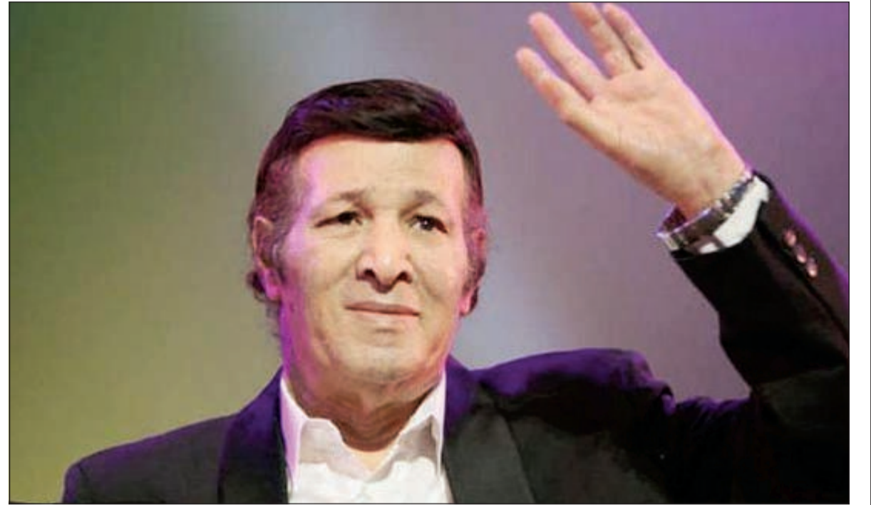
ودادا سعيد صالح

في غيبوبة. الراحل يعد واحدا من أبرز نجوم الكوميديا في مصر، ورحل بالزمان مع عرض اثنين من أبرز مسرحياته خلال إجازة عيد الفطر، هما «العيال كبرت» و«مدرسة المشاغيبين»، حيث شارك يونس شلبي وأحمد زكي بطولة الأولى، بينما اقتسم بطولة الثانية مع عادل إمام وزكي وشلبي.