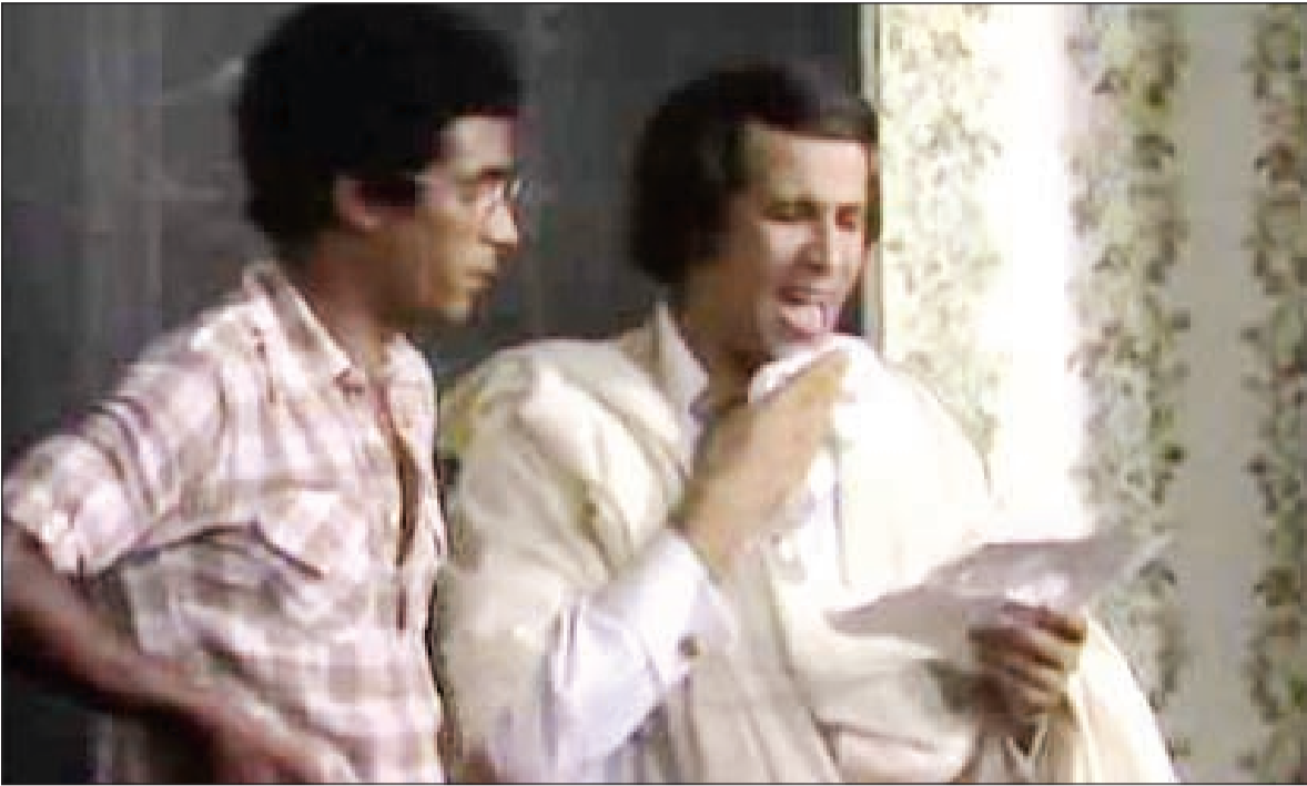
مع أحمد زكي في «العيال كبرت»