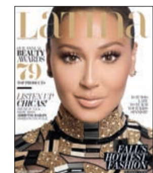
أدرين على غلاف المجلة

وسئمت أدرين من أن كل الناس تقول انها دمرت حياة حبيبها السابق روب كارديشيان، معتبرة انها كانت تلعب بالباربي حين قابلته. وكتبت كليو أرف FDB على أحد مواقع التواصل الاجتماعي تعليقا على صورتها مع شقيقها روب. وعاد روب ليعرّد تلك الأ حرف التي تشير إلى جملة «تبا لتلك العاهرة». وتلك الكلمات كانت موجّهة إلى حبيبة روب السابقة الممثلة أدرين بايلون. وعلقت كيم كارديشيان على كلام أدرين من خلال صفحتها على أحد مواقع التواصل الاجتماعي حيث كتبت: «إنه من المضحك حين تقول ان تكون مع «كارديشيان» يضر بمهنتها، فالسبب الوحيد لأن يكون لها مقابلة أصلا هو لتحدثت عن «كارديشيان».