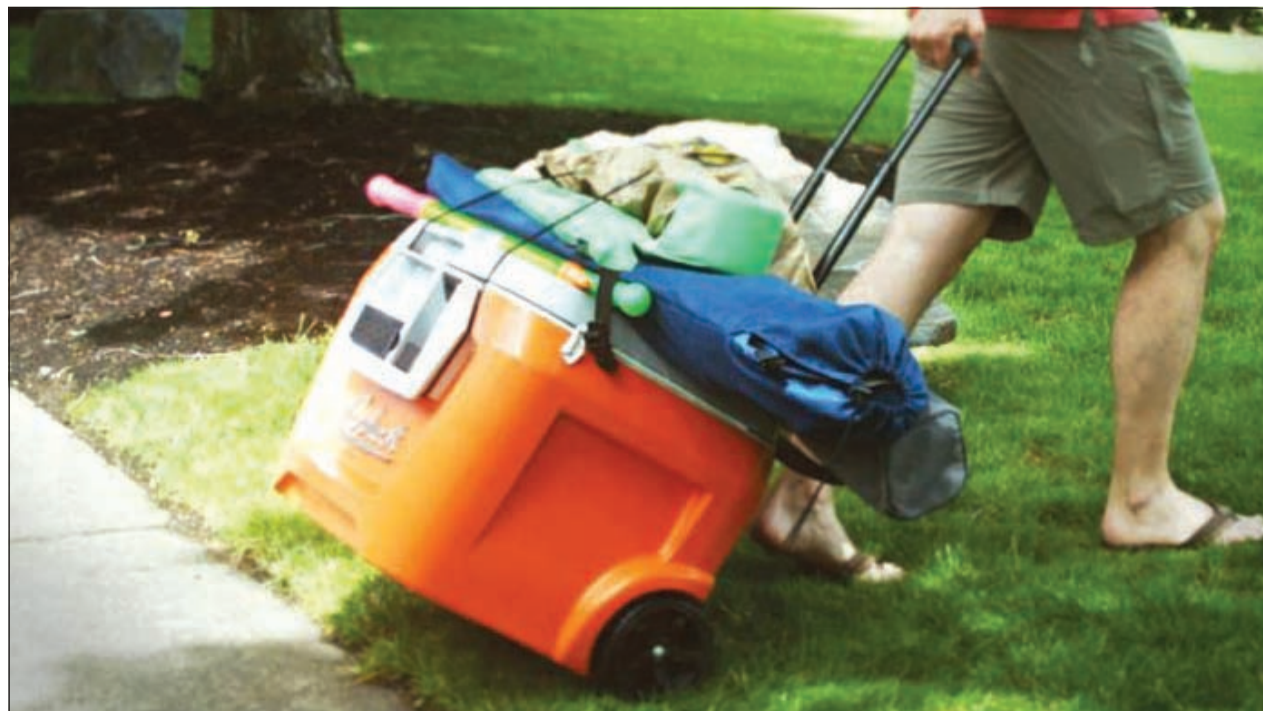
استعمالات عدة للبراد الذكي

تعود الأسواق المحلية والإقليمية للعمل غدا بعد اجازة طويلة. ولعل أبرز ما سيراقبه المستثمرون في المنطقة هو تفاعل أسواق السعودية ودبي بعد الأحداث السريعة في هذين السوقين. وتشير «رويترز» في أحدث تقاريرها الى أن هناك نقاشا من مستثمري المنطقة تجاه سوق الأسهم السعودية بعد إعلان فتح السوق أمام المستثمرين الاجانب اعتبارا من 2015، في حين لا يزال المستثمرون يظهرون تشاؤما تجاه الإمارات. وفي الواقع، ان سوق دبي المالي تأثر سلبا بأحداث شركة أربنك في شهر يونيو الماضي، وهو أمر يستدعي من السلطات الرقابية في الإمارات التوقف عنده ومنع حدوثه في الفترة المقبلة لكي لا تخسر البورصة من مكانتها الإقليمية والعالمية. فقد ارتفع سعر سهم أربنك بنسبة 400٪ ليعود ويخسر