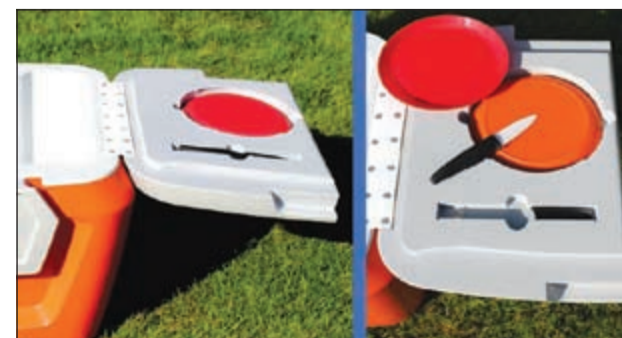
الأغراض المتعددة للبراد