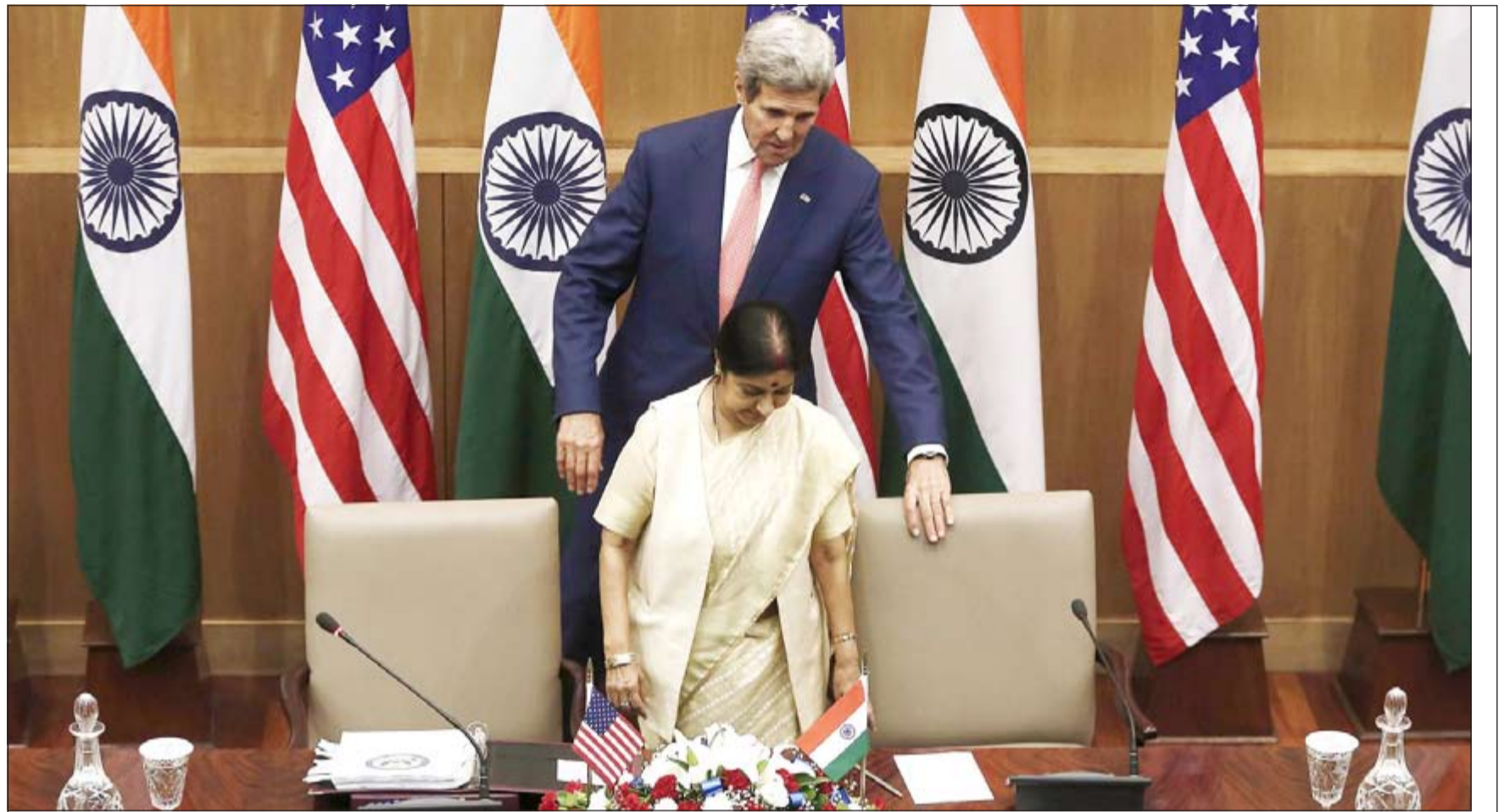
وزير الخارجية الأميركي جون كيري يعدل الكرسي لجلوس وزيرة الخارجية الهندية سوشما سواراج في اجتماع منظمة التجارة العالمية لتحديد القواعد الجمركية بين الدول (رويترز)

وقال المصدران المطلعان انه بموجب الخطة التي يجري بحثها حاليا بين دبي العالمية ومستشاريها وكبار البنوك الدائنة ومنها إتش.إس.بي.سي والإمارات دبي الوطني سيتم تمديد استحقاق العام 2018 إلى 2022 في مقابل السداد المبكر للمبلغ المستحق في مايو القادم بالكامل.