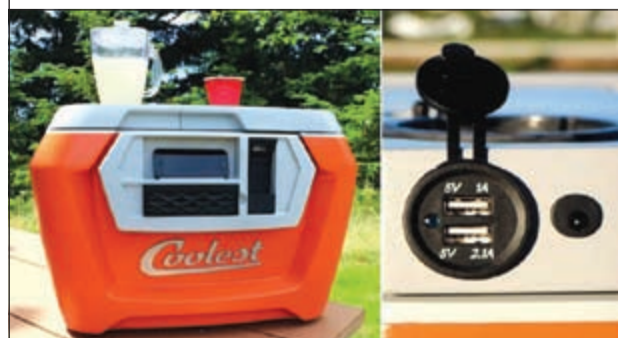
بلوتوث وشاحن USB للبراد الذكي