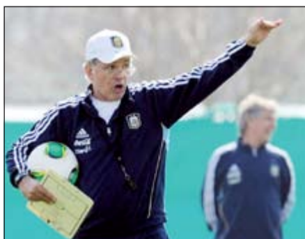
الخباندر سابيللا يرفض التجديد مع الأرجنتين

لن يستمر المدرب الخباندر سابيللا، الذي ينتهي عقده مع الاتحاد الأرجنتيني لكرة القدم في نهاية سبتمبر المقبل، على رأس الجهاز الفني للمنتخب، بعدما اقترح الاتحاد عليه التجديد، وفق ما أكدت الصحافة الأرجنتينية. وكثبت صحيفة «لا ناسيون» على موقعها على الإنترنت: «الرجل الذي قاد الأرجنتين إلى نهائي المونديال لمواجهة ألمانيا قال لخوليو غرونديونا (رئيس الاتحاد الأرجنتيني) إنه لن يكمل مع المنتخب». ورفض المتحدث باسم الاتحاد أن يؤكد لوكالة الصحافة الفرنسية المعلومة التي أوردتها الصحيفة، مكتفياً بالإشارة إلى أن سابيللا سيعقد مؤتمراً صحافياً في بونينس آيرس.