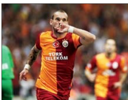
ويسلي سنايدر من العناصر المخضمة في غلطة سراي

أعلن رئيس نادي غلطة سراي التركي لكرة القدم أونال أيسال أن اللاعب الهولندي الدولي المخضرم ويسلي سنايدر سيبقى في صفوف الفريق هذا الموسم رغم التكهنات باحتمال رحيله بعد أدائه الجهد في مونديال البرازيل.