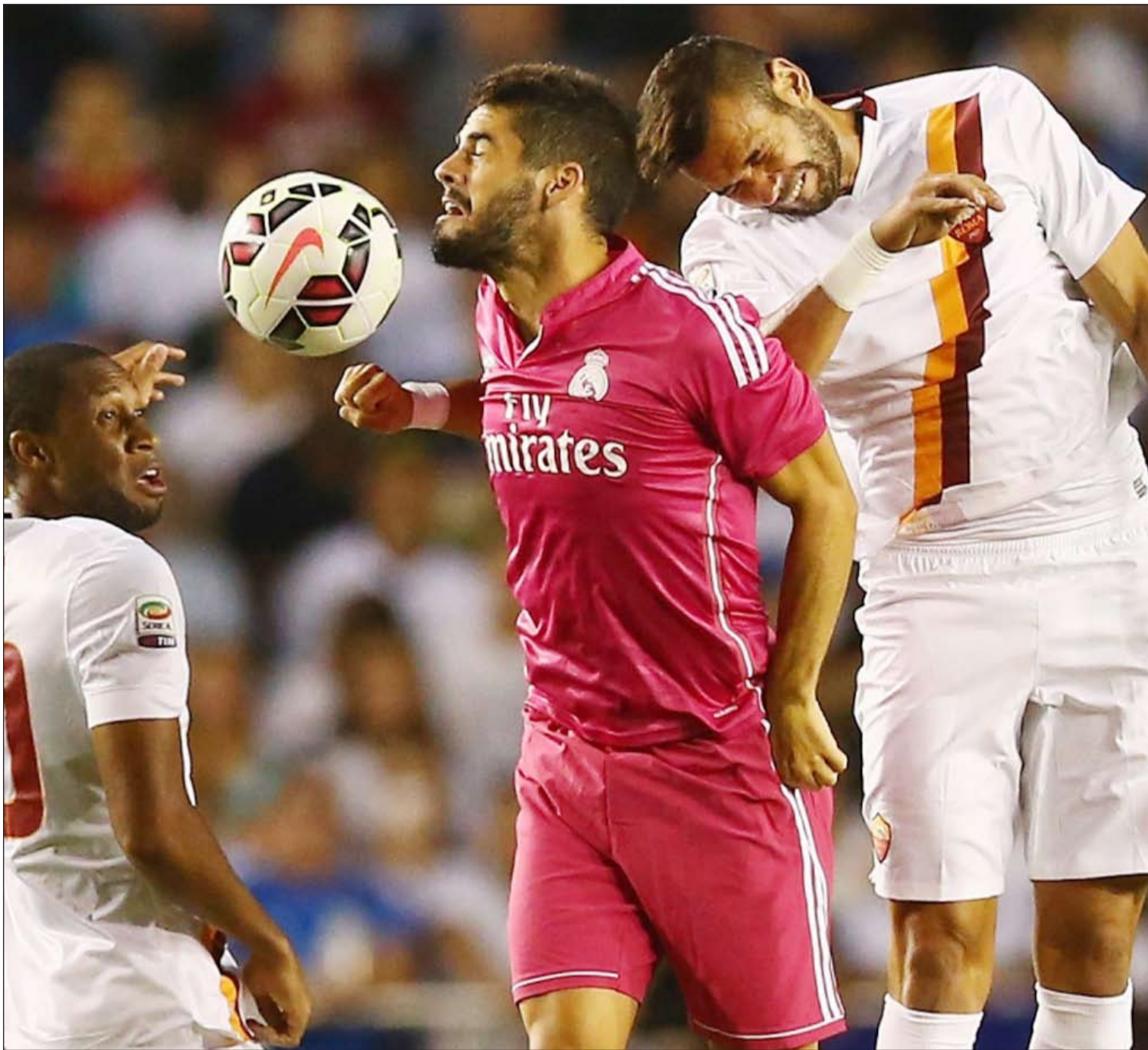
لاعب ريال مدريد إيسكو في صراع هوائي مع لاعبي روما سيديو كيتا ولياندرو كاستانو

ويعتبر توريه أفضل لاعب في «الستيزن» الموسم الماضي وهداف الفريق وأحد أعمدة الفريق في ظل سعيه للحفاظ على لقب البريميرليغ الموسم المقبل بجانب المنافسة على لقب دوري أبطال أوروبا.