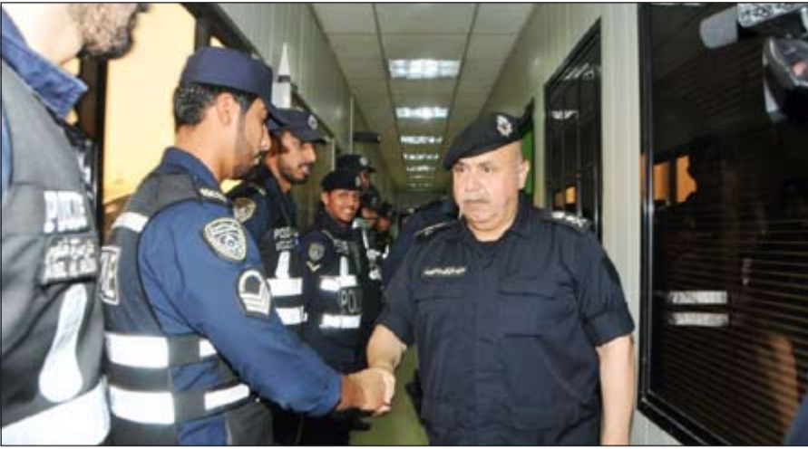
الفريق سليمان الفهد يصافح عددا من رجال النجدة

والوقائية للمواطن والمقيم، والتي ترتقي بمستوى العمل مشددا على أهمية التواجد في أماكن التجمعات والأماكن الترفيهية التي تشهد كثافة بشرية والمناطق السكنية ونقاط التفتيش الأمني الثابتة والمتحركة على الطرق، بالإضافة إلى جانب القيام بالدور الإنساني والمساعدة لطالب النجدة.