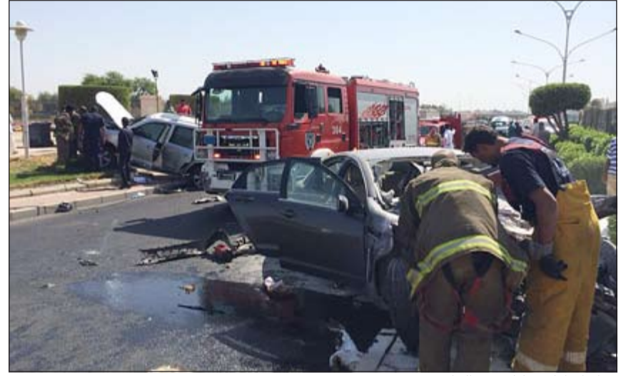
رجال الإطفاء يتعاملون مع الحادث