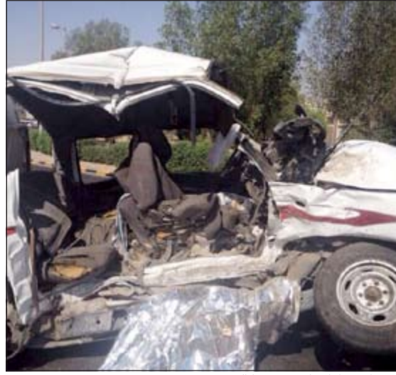
قوة الاصطدام تكشف عنها الصورة

والتبين مصرع 3 أشخاص اثنان منهم يحملان الجنسية البنغلاديشية والشخص الثالث إثيوبي الجنسية، وقام رجال الإطفاء بتسليم الحث للأدلة الجنائية، فيما نجا الشخص الرابع المحشور وتم تسليمه لغنبي الطوارئ الطبية لعمل اللازم تجاه الإصابات التي لحقت به، حضر للموقع رجال الأمن لتنظيم حركة السير وتسجيل قضية أحييت للمخفر المختص.