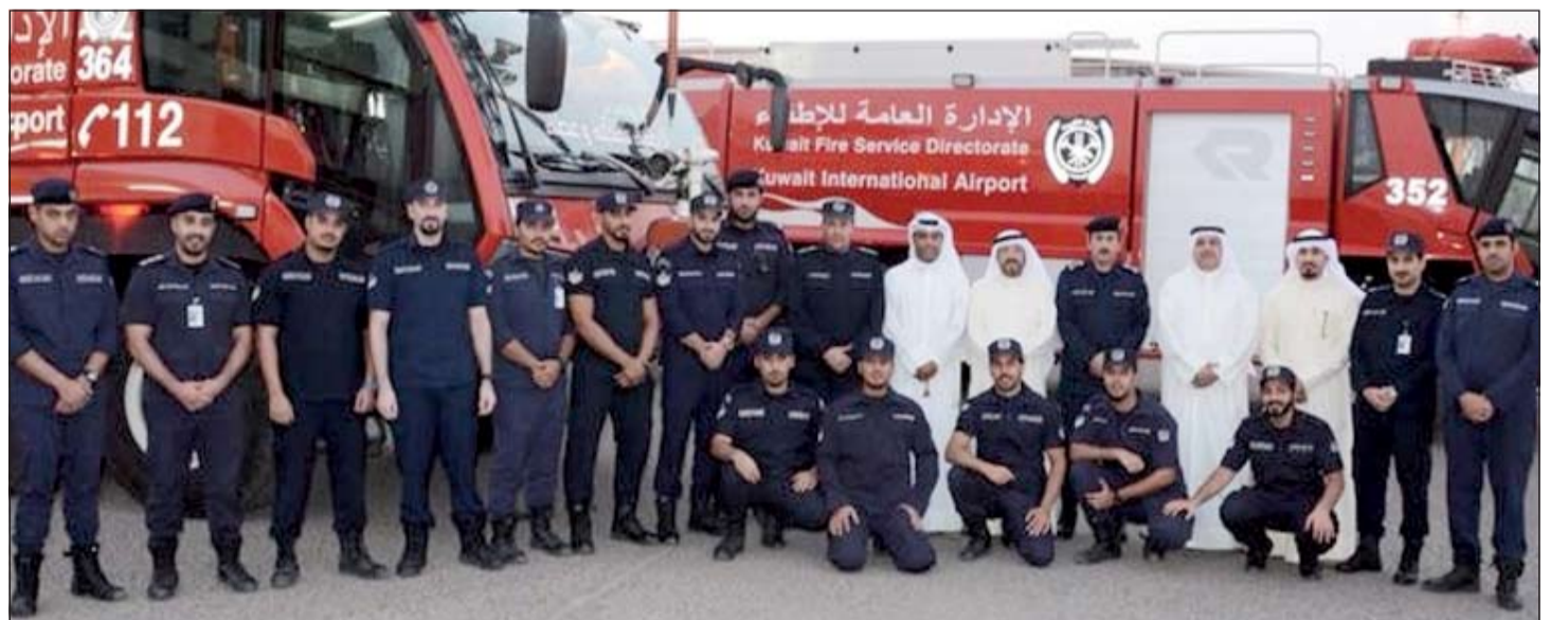
اللواء الأنصاري متوسطا قوة مركز المطار العسكري

الوزراء ووزير العدل بالوكالة الشيخ محمد عبدالله بهذه المناسبة، مؤكدا أن الإدارة العامة للإطفاء تحظى بالدعم الكامل والمتواصل من القيادات العليا للقيام بواجبها المنوط بها على أكمل وجه والنظر الى احتياجاتهم ومتطلباتهم. وفي ختام الزيارة وجه اللواء الأنصاري الشكر لرجال الإطفاء، مشيدا بالجهود الكبيرة التي يقومون بها في سبيل حماية الأرواح