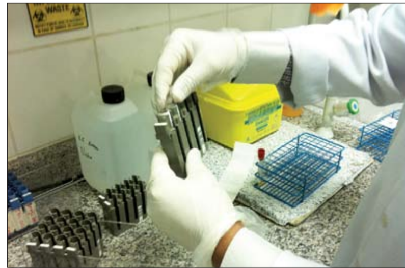
التعامل بحذر مع العينات