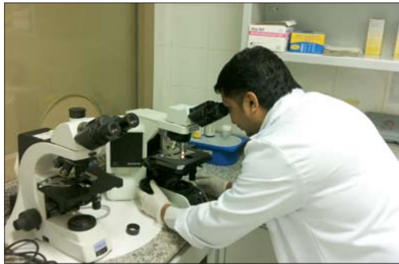
فحص العينات من خلال التلسكوب

مشكلة الخزانات مطلبات فنيو المختبرات دعوا ديوان الخدمة المدنية وادارة الصحة المهنية الى اقرار جميع البدلات المستحقة للفنيين، والتي تتمثل في «الخطر - العدوى - التلوث - الضوضاء»، مبيدين