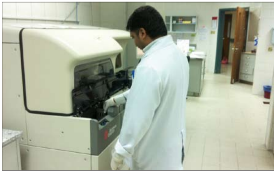
صوت الاجهزة في المختبرات يعرضهم للضوضاء

الاخر على المدى الطويل بسبب العقم وضيق النفس والسرطان. واقادوا بان من اهم العوامل التي تجعل من طبيعة العمل في المختبرات خطرة هي التعرض للأخطار الحيوية، والتي تتمثل في العوامل المعدية مثل البكتيريا والفيروسات والطفيليات والفطريات المعدية، منها «الدرن - الاثرأكس - بورتيدلا - جبيررتوسيس - البروسيلا - التايوسيريا - الهيستوبلازما - التهاب الكبد الوبائي» وغيرها من الامراض المعدية التي تعرض فنيي المختبرات الى الخطر، كما انهم يتعاملون مع مواد كيميائية خطرة، علماً بان هذه