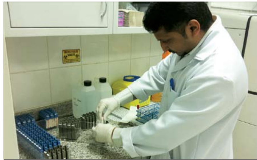
فنيو المختبرات يتعاملون مع عينات يمكن ان تعرضهم للخطر والعدوى

المواد ورغم الحذر في التعامل معها، الا ان بعضها يؤدي الى حدوث تسمم، كما ان بعض هذه المواد معروفة بخواصها المسرطنة، ويجب التعامل معها بحذر شديد، ورغم كل ذلك فلا يوجد تعويض للعاملين في المختبرات الطبية من هذه الامور السلبية، والتي قد تسبب له امراضا مسرطنة، مشيرين الى ان تلك المخاطر سابقة الذكر لا تضاهيها اي مزايا مالية ولا بدلات، ولا تحمي منها، لكنها تشجع العاملين في المختبرات الطبية على تحمل تلك المخاطر بعد بذل الجهد في تحقيق وسائل الحماية والسلامة قدر المستطاع. واختتم فنيو المختبرات تصريحهم بالمطالبة بالتعامل مع مهنة المختبرات الطبية بنظرة تقييمية مختلفة على ضوء ما تحويه تلك المهنة من مخاطر ومشقة من جهة، وما وصلت اليه من تقدم علمي ملموس جعلها في مقدمة المنظومة الطبية والتشخيصية والعلاجية، متمنين شمول مهنتهم مع المهنة النادرة، وذلك لخطورتها واهميتها في العمل بالمستشفى، وفي التشخيص.