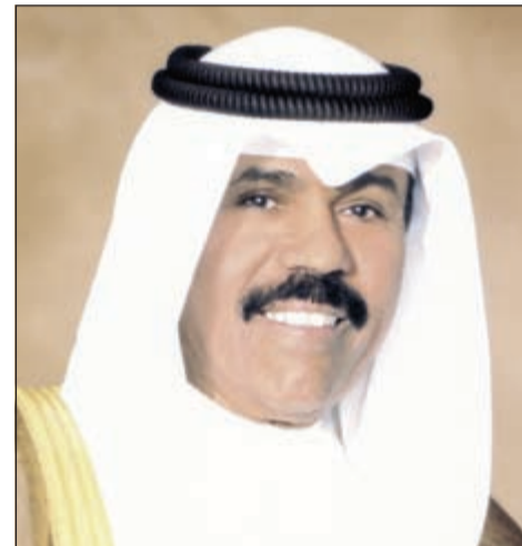
سمو نائب الأمير وولي العهد الشيخ نواف الأحمد

خاطب ديوان المحاسبة وزارة الصحة بشأن تزويده بجميع الإجازات المرضية الممنوحة لموظفي الدولة على مستوى كل جهة حكومية خلال السنوات من 2011-2013 لفحصها والتدقيق عليها جيدا، وذلك ضمن مهمته في تقييم الأنظمة المتعلقة بالإجازات المرضية لموظفي الجهات الحكومية وفقا للقانون 30 لسنة 1964. وطلب ديوان المحاسبة من «الصحة» عبر خطاب حصلت «الأنباء» على نسخة منه بيانا بجميع الإجازات المرضية بما لا يتجاوز 3 أيام في المرة الواحدة بكل من مراكز الرعاية الصحية الأولية والمراكز الطبية الخاصة والمستوصفات والعيادات الخاصة، كما طلب بيانا بجميع الإجازات المرضية الممنوحة لموظفي