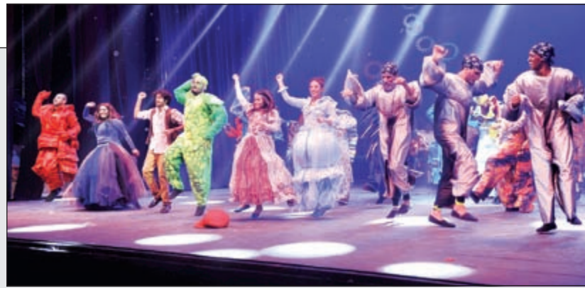
من المشاهد التي استحوذت على إعجاب الجمهور

«زين البحار» عرض مسرحي استعراضي مبهر يحكي قصة عروس البحر 13