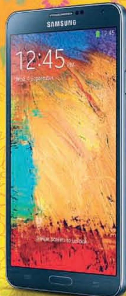
Samsung Galaxy Note 3