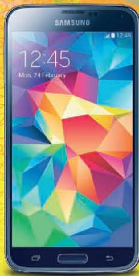
Samsung Galaxy S5