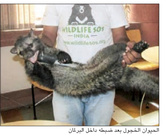
الحيوان الخجول بعد ضبطه داخل البرلمان

السذي يبدو مثل القطة عدة نقاط أمنية في المبني الذي يخضع لحراسة مشددة. وقالت الصحفية إن الحيوان ربما اقتحم البرلمان بحثا عن ماوى. ويعتبر هذا الحيوان من الحيوانات التي يمكن الحصول على المسك منها، وكان الحيوان يعاني من الحفاف، وسيتم إرساله إلى مكان إيواء طبيعي قريبا. ويذكر أن المسؤولين العاملين بالوزارات الحكومية بالقرب من البرلمان تعرضوا