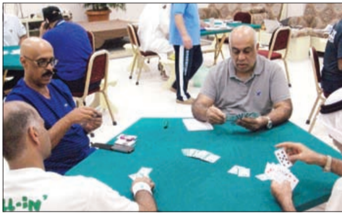
... وجانب من منافسات لعبة الهاند