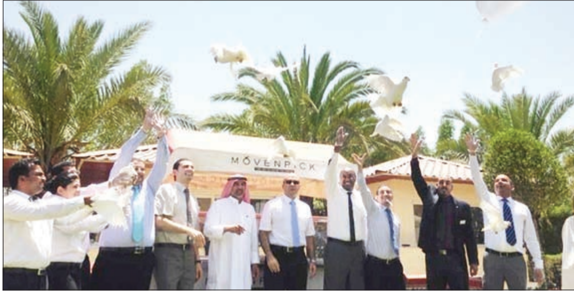
إطلاق الحمام في موفنيك المنطقة الحرة

العلاء لقضاء أوقات ممتعة على أنغام الموسيقى العربية الأصيلة. كما أكد مدير العلاقات العامة السيد العاصي أن إطلاق طيور السلام البيضاء اللون من موفنيك الكويت بالمنطقة الحرة تحمل في طياتها رسالة في فحواها السلام والرخاء والأمن لدولة الكويت الحبيبة ضمن فعاليات إعادة افتتاح الجاردن كافييه.