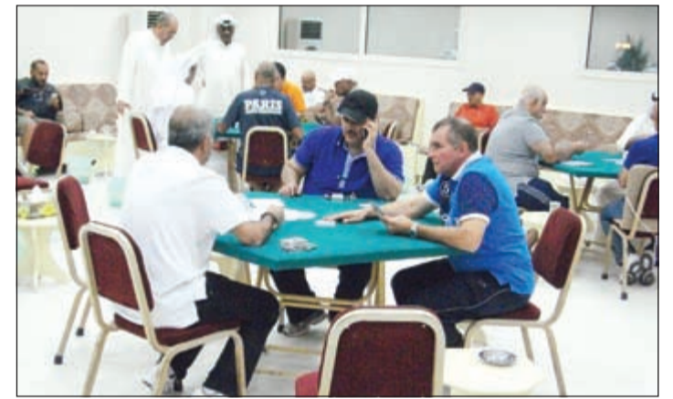
مشاركة واسعة للأعضاء في مسابقات الألعاب الشعبية

والإبراز مهاراتهم وخبراتهم وقدراتهم في الألعاب الشعبية إلى جانب إتاحة الفرصة للالتقاء فيما بينهم.