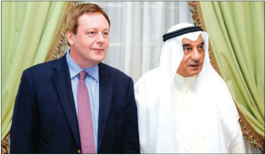
عبدالله بشارة والسفير البريطاني فرانك بيكر

ورد السفير فرانك بيكر بكلمة شكر فيها الجمعية على دعمها، مؤكدا أهمية توطيد العلاقة بين الكويت وبريطانيا، والدور المهم الذي تلعبه الجمعية على الجانبين، واختتم كلمته قائلا «تنتابني مشاعر الحزن لمغادرة الكويت. ورغم ترك وظيفتي، إلا أنني سأحتفظ بأواصر الصداقة والعلاقات الطيبة التي جمعتني بالعديد من الشخصيات هنا. واتقدم بوافر الشكر إلى الجمعية على هذه الأمسية الرائعة. وقد استمتعت بالعمل عن كثب مع جمعية الصداقة الكويتية - البريطانية». واختتمت الأمسية بسحب على هدايا تقديرية قدمت إلى السفير بيكر، مع أطيب التمنيات له بدوام النجاح والتوفيق في عمله كسفير في العراق.