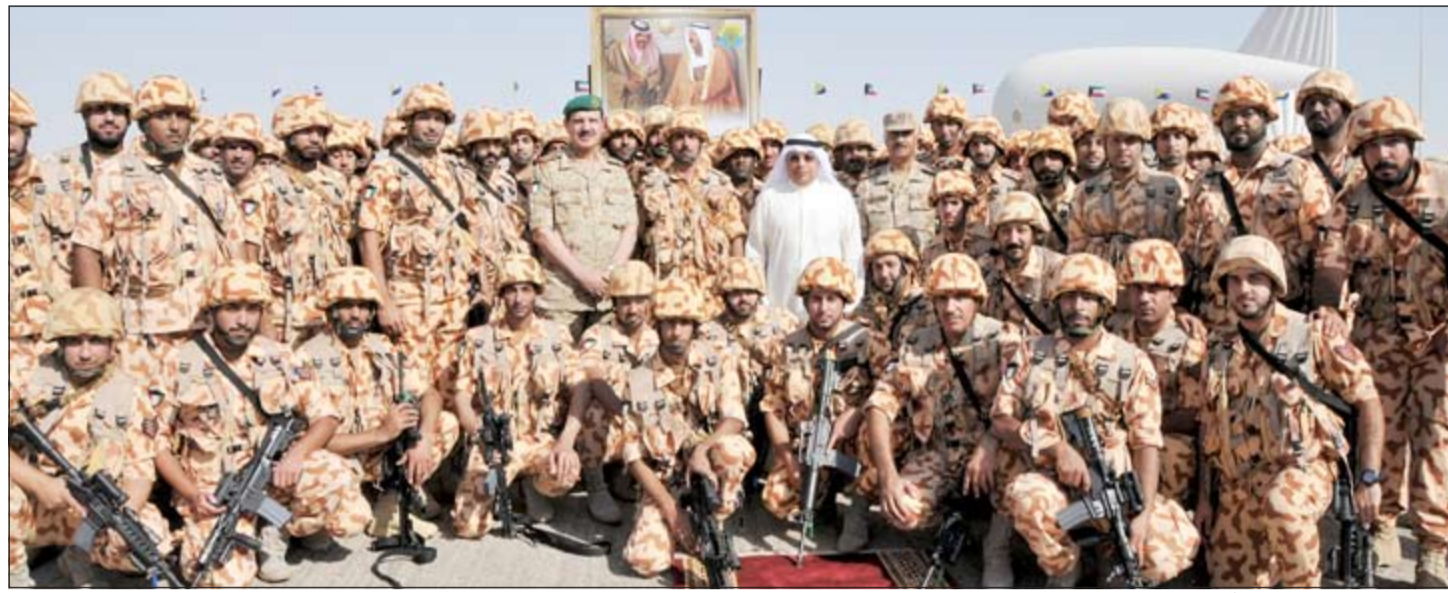
الشيخ خالد الجراح متوسطا أعضاء لواء المغاوير