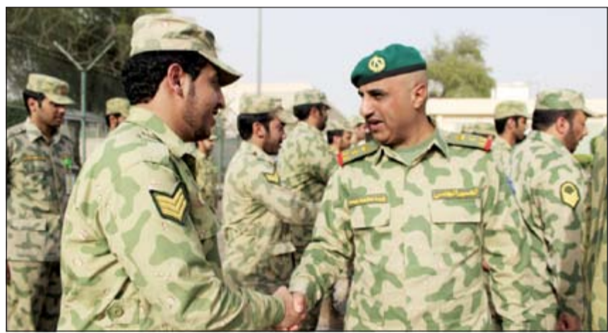
الععيد الركن زيد محمد زيد مصافحا احد الضباط

قام ركن عمليات وتدريب قيادة الشؤون الأمنية في الحرس الوطني العميد الركن زيد محمد زيد برفقة أمر كتيبة حماية وتأمين المنشآت الأولى الرائد أحمد نومان، وأمر الكتيبة الثالثة بالتكليف الرائد فريخ علي الفريخ وعدد من الضباط بتفقد مواقع الحراسات الخارجية التابعة للحرس الوطني، حيث نقلوا إليهم تهناني وتبريكات سمو رئيس الحرس الوطني الشيخ سالم العلي ونائب رئيس الحرس الوطني الشيخ مشعل الأحمد، ووكيل الحرس الوطني بالتكليف اللواء ركن م.هاشم الرفاعي بمناسبة عيد الفطر.