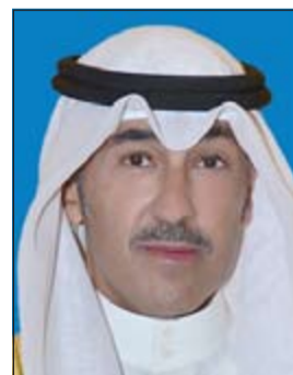
الشيخ فواز الخالد

جاء ذلك في لقاء وحاورات مباشرة خلال جولة تفقدية للمحافظ لمخفر منطقة الصباحية برفقة مدير عام