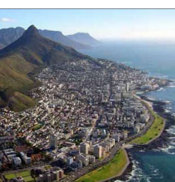
استثمار مريح في كيب تاون الشرقية خصوصا في قطاع السيارات

3 كازابلانكا - المغرب وجاءت مدينة كازابلانكا بعد القاهرة، حيث تتشابه معها في اتجاه الاستثمارات الأجنبية المباشرة، وجاءت قطاعات التجزئة والإعلام والمنتجات الاستهلاكية والخدمات المالية من أكثر القطاعات فيها جذبا