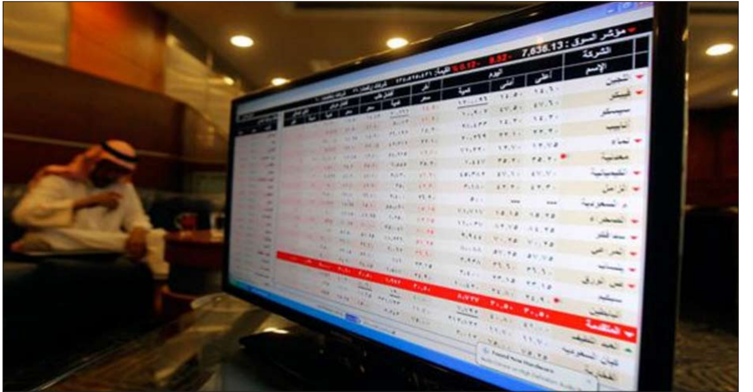
زخم كبير على الاسهم السعودية