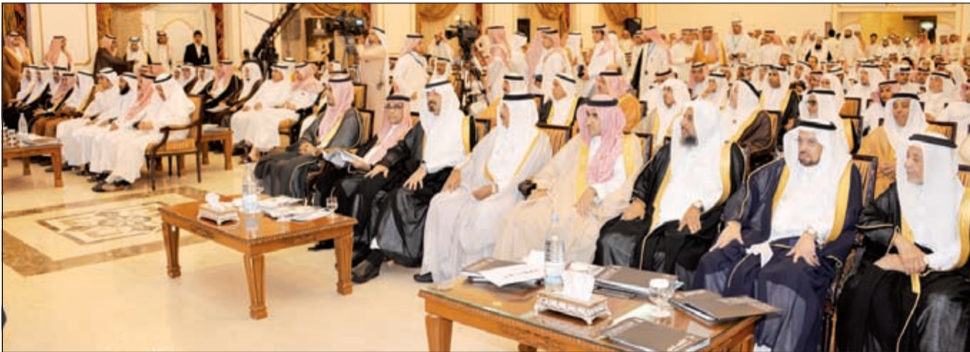
كبار المدعوين من الوجوه والتجار والعاملين في المجال الخيري أثناء وقائع الحفل

الجمعية لتقدمها للمستفيدين وفق أنظمة ولوائح الجمعية وبناء على ما يتوافر لديها من موارد مالية لهذه البنود وهي: مساعدة الإيجار، وصيانة وترميم المنازل، والمساهمة في تأثيث المنزل، ودعم الأسر المنتجة، والمساعدة في سداد فواتير الكهرباء، وتأمين الأجهزة الكهربائية المنزلية، إضافة إلى صيانة الأجهزة الكهربائية، والرعاية الصحية، وتأمين المواصلات، وتأمين الأدوية والأجهزة الطبية، والتحويل إلى المدارس الأهلية، والمساعدة في سداد فواتير الماء، والتعليم العالي الخاص، والتدريب، والتوظيف، وتحفيظ القرآن الكريم. أما الخدمات المساندة (الموسمية) فهي التي تقدمها في مواسم معينة بناء على ما يرد بها من تبرعات للخدمة ومنها: الحج والعمرة، وزكاة الفطر، وهدية العيد، ومستلزمات كسوة الشتاء، والأضاحي، والسلة الرمضانية، والحقيبة المدرسية، والمستلزمات المدرسية، ودروس التقوية، وهدية النجاح (التفوق العلمي)، والابتعاث لإكمال التعليم الجامعي.