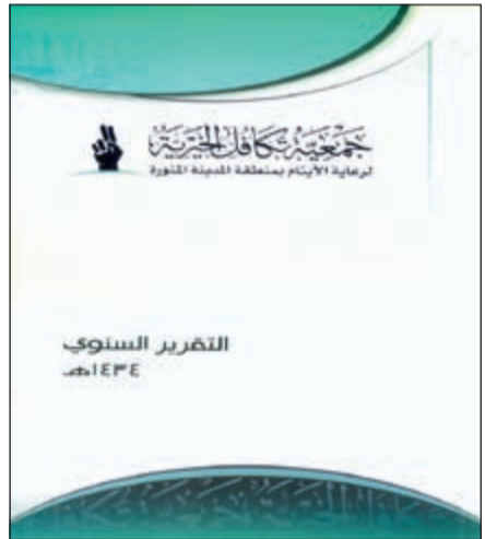
أحد إصدارات جمعية تكافل الخيرية