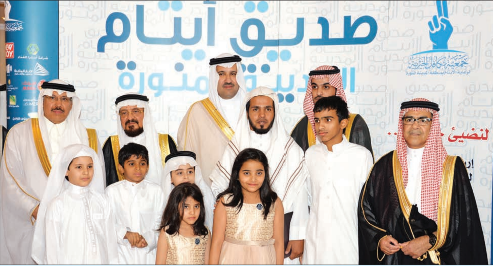
صاحب السمو الملكي الأمير فيصل بن سلمان .. صديق الأيتام وراعيهم

كما كرم سموه عددا من رجال الأعمال الداعمين والإعلاميين الذين انتدبتهم الجمعية لسفراء لأيتام المدينة المنورة، وراحة الحملة الإعلامية التعريفية التي أقامتها الجمعية التي وجدت صدى واسعا وتفاعلا كبيرا في مجتمع طيبة الطبية. إلى ذلك، أعرب أمين عام الجمعية د.عبدالمحسن الحربي عن خالص شكره وشكر مجلس إدارة الجمعية لسمو الأمير فيصل بن سلمان بن عبدالعزيز، على حرصه الكبير والاهتمام الذي يوليه للجمعية ودعمه لأيتام منطقة المدينة المنورة، مؤكداً أن هذا ليس بمستغرب على سموه الذي عُرف بدعمه المتواصل لمشروعات الخير والعطاء في جميع المجالات، ونوه بالدعم والرعاية اللذين يحظى بهما القطاع الخيري من حكومة خادم الحرمين الشريفين الملك عبدالله بن عبدالعزيز آل سعود وسمو ولي عهده الأمين وسمو ولي ولي العهد - حفظهم الله - كما وجه شكره وتقديره لأهل الخير والإحسان الذين طابت أنفسهم بدعم الأيتام والتبرع لهم ممن شرفوا الحفل ولجميع المحسنين الذين سخط أبايهم بالعطاء حتى يحيا هذا اليتيم حياة كريمة. وأضاف الحربي أن الجمعية تتطلع لتحقيق الريادة في العناية بشريحة الأيتام العزيزة على قلوبنا جميعا، وأن تعكس جهود الدولة المباركة في خدمة شرائح المجتمع كافة والرفع من معاناتهم وتحسين مستوى معيشتهم. يذكر أن جمعية تكافل الخيرية لرعاية الأيتام بمنطقة المدينة المنورة ترعى أكثر من 8000 يتيم ویتيمة وأمهاتهم رعاية معيشية وصحية وتربوية وتعليمية، وتسعى لأن تكون نموذجا يقتدى في العناية بالأيتام في جميع حاجاتهم المعيشية والنفسية والتعليمية والتربوية والتأهيلية.