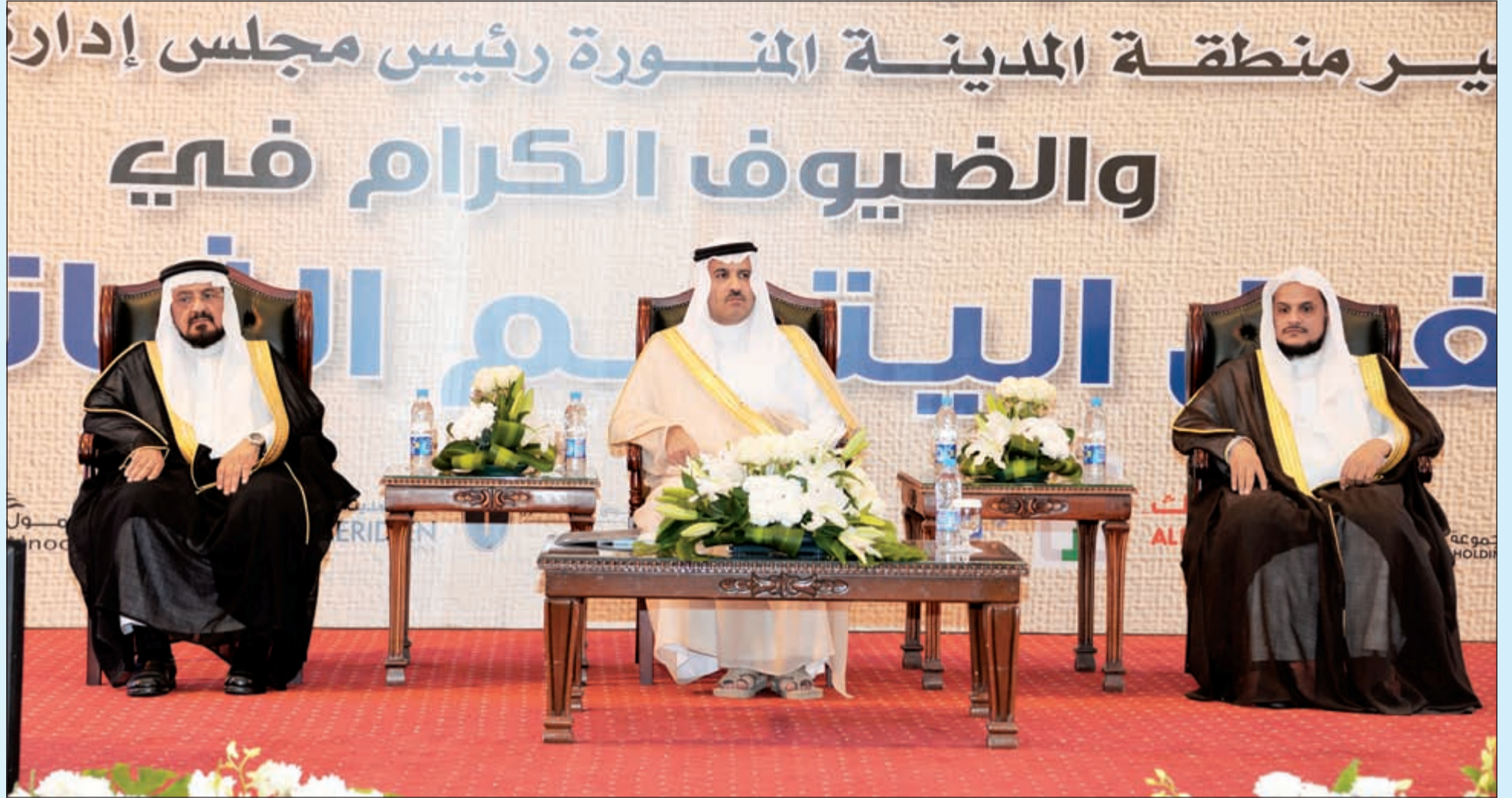
صاحب السمو الملكي الأمير فيصل بن سلمان بن عبدالعزيز أمير منطقة المدينة المنورة مفتتحا حملة التبرعات

وافتتح الأمير فيصل بن سلمان التبرعات بمبلغ مليون ريال، ثم توالى التبرعات بما جاد به أهل الخير والإحسان من مختلف مناطق المملكة، في ليلة من ليالي الخير والبذل والعطاء والتي تؤكد مدى تلاحم الشعب السعودي وحبه للخير ودوره الكبير في التكافل الاجتماعي. وكان الحفل الذي أقيم بفندق المريديان بالمدينة المنورة قد بدأ بمقدمة ترحيبية من طفلين من أبناء المنطقة ثم بتلاوة آيات من القرآن الكريم، لتبدأ بعدها حملة التبرعات وإعلان المبالغ المتبرع بها وأسماء المتبرعين، بعدها كرم سمو أمير منطقة المدينة المنورة عددا من الشخصيات والشركات التي ساهمت في دعم الجمعية خلال العام الماضي ورعاية الحملة الإعلامية التعريفية التي نفذتها الجمعية مع بداية شهر رمضان لهذا العام بعنوان «لا تنساني»، وذلك خلال رعايته حفل التبرع السنوي الثاني، الذي أقامته جمعية تكافل الخيرية لرعاية الأيتام بمنطقة المدينة المنورة.