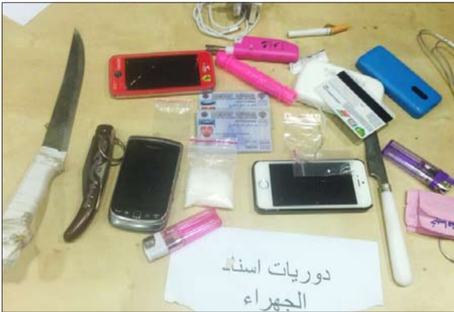
المضبوطات تنوعت بين مخدرات وادوات حادة