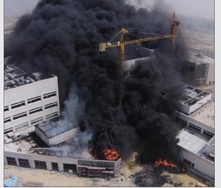
سحب دخانية كثيفة خلفها الحريق الضخم