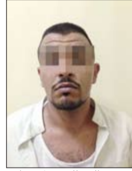
البدون مطلوب للسجن 6 سنوات