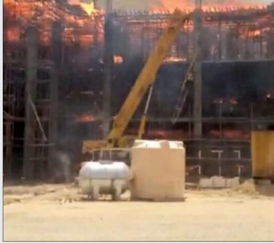
الحريق امتد على مساحة 90 ألف متر مربع وشمل مبنين