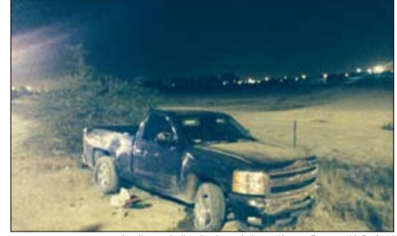
المركبة المسروقة بعد الاصطدام بها على الدائري السادس