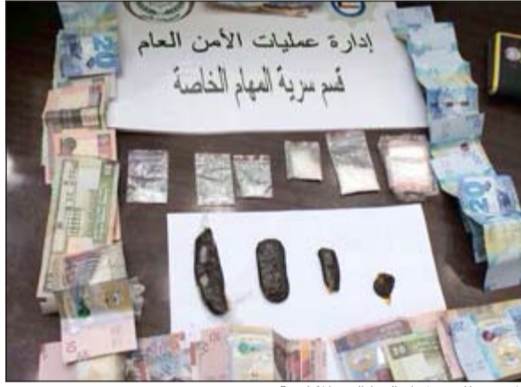
المضبوطات قبل إحالتها إلى «المكافحة»

حصيلة بيع المواد المخدرة، وبحسب مصدر أممي فإن دورية تتبع إدارة المهام الخاصة التابعة لقطاع الأمن العام وخلال جولة لها في منطقة حولي اشتبهت في مركبة بها شخصان كانا في حالة ارتباك وتعاط، حيث تم توقيف المركبة وإخضاعها للتفتيش والعثور على المواد المخدرة بالسيارة، وعليه تم إخطار وكيل وزارة الداخلية اللواء العلي الذي أمر باتخاذ الاجراءات القانونية بحق الوافدين.