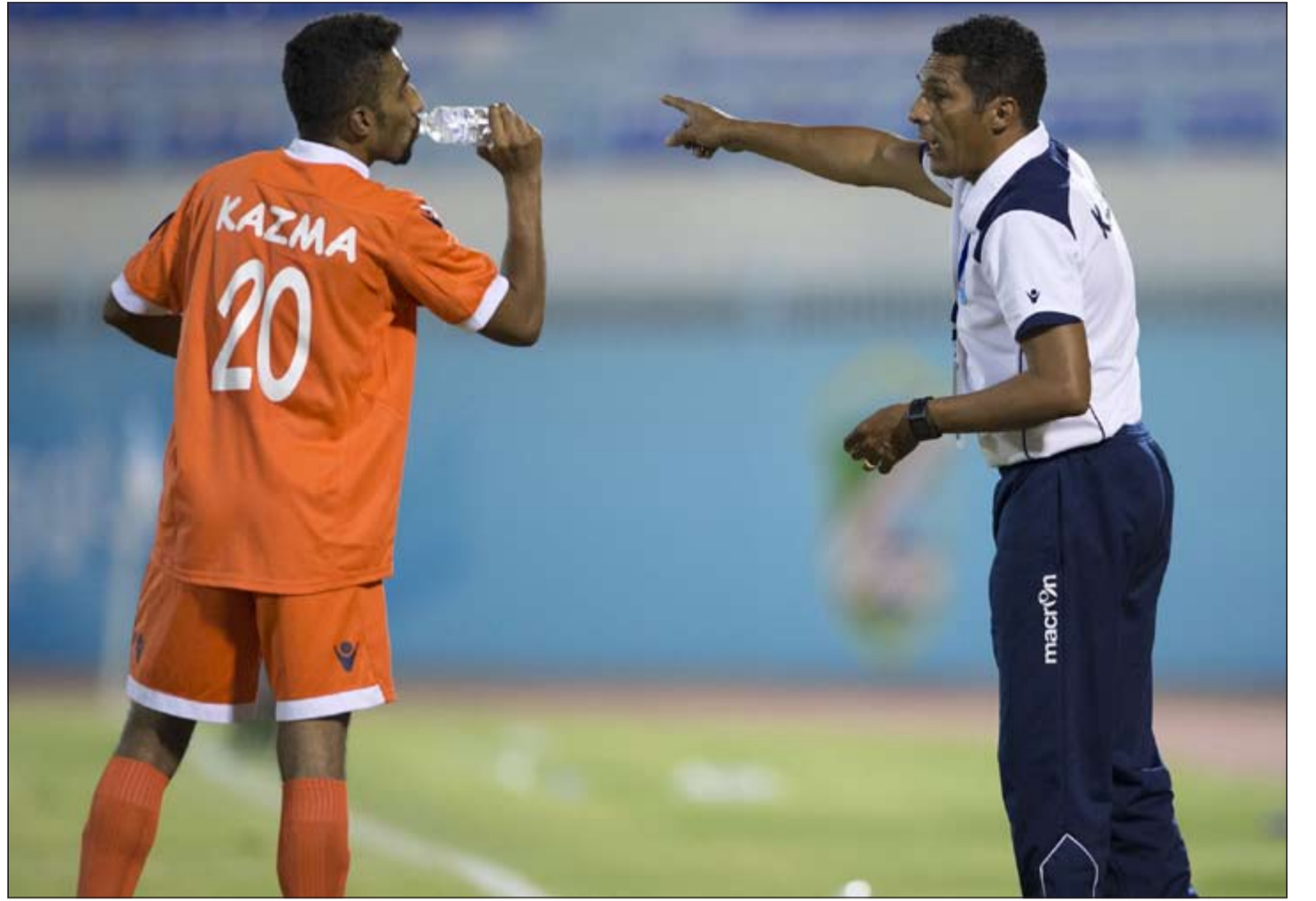
مدرب كاظمة جانشيه ديسلغا يامل في الاستفادة من المعسكر الخارجي