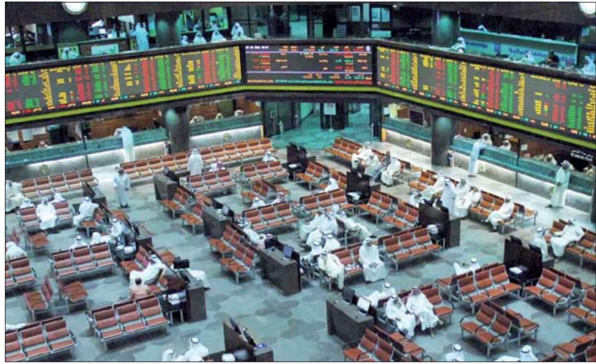
ضغوط مالية ستواجه شركة البورصة عند تخصيصها

مفوضي الهيئة الخمسة في 08/ 09/ 2014، وكان مشروع تخصيص البورصة يتم برعاية المفوضين الحاليين، ولا نعرف ما سوف يخلفه أثر التغيير في مجلس المفوضين حجما ونوعا عليها، وأمر ثالث غير ملائم أيضا وهو ما يجري من حديث حول تعديل على قانون هيئة أسواق المال، ورغم أنه تعديل مستحق، إلا أن جرعة السياسة وصراع المصالح الذي كانت بدايته انقلاب تعديل مادة مدة الولاية، قد يؤثر سلبا على استقرارها وعملها، أي أنها عرضة لتأثير تغيير إدارة وقانون هيئة أسواق المال. وفقى بداية استعراض خطوات البناء، ذكر رئيس مجلس الإدارة لشركة البورصة ملحوظة وثلاث خطوات، الملحوظة هي في عدم التداخل مع عمل البورصة الحالية في وقت مبكر، أي أن البورصة الحالية سوف