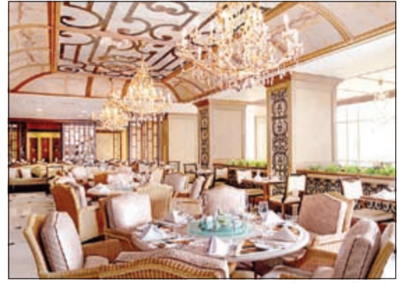
طريق الحرير في الريجنسي