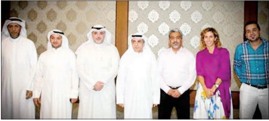
ترحيب بضيوف غيقة «مدى للاتصالات»