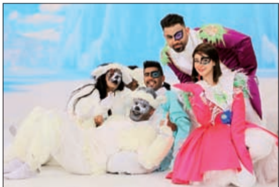
..وفي «مدينة البطاريق» 2