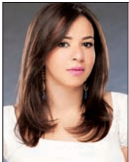
إيمي سمير غانم

دورها في مسلسل «فيها أطاها» الذي تتقاسم بطولته مع محمد سعد، وهو من إخراج سامح عبدالعزيز، كما تشارك أيضا مع هند صبري في مسلسل «أميرة مصرية» لتظهر في شخصية فتاة شعبية. من ناحية أخرى، تنتظر إيمي انتهاء رمضان لعودة عرض مسلسلها «هبة رجل الغراب» الذي حقق نجاحا كبيرا قبل الشهر الفضيل.