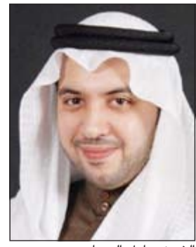
الشيخ مبارك الصباح