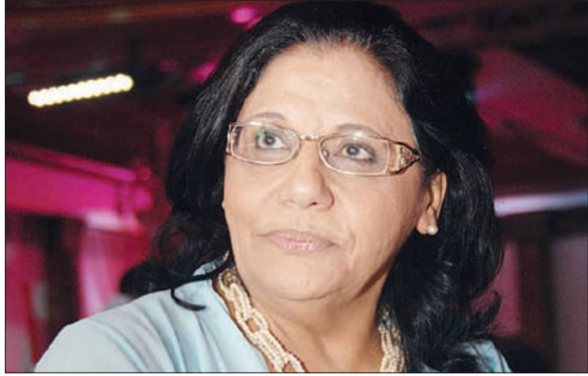
الفنانة والكاتبة القديرة اسمهان توفيق