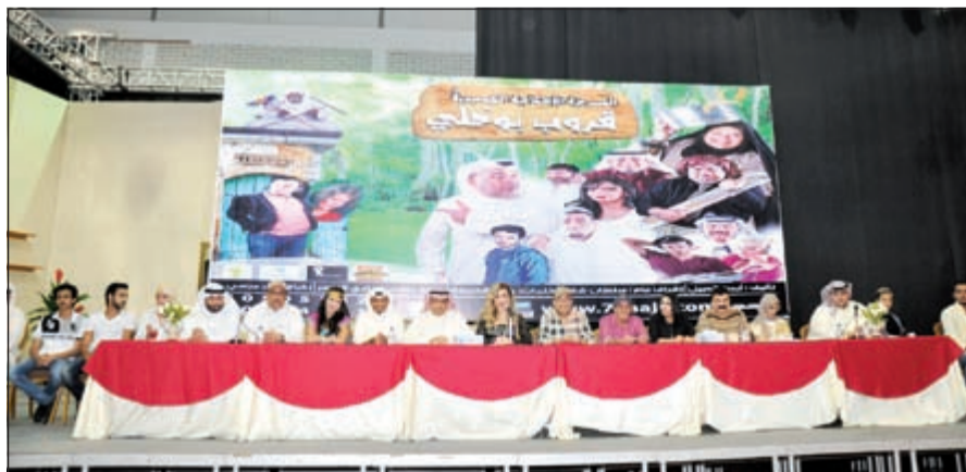
«قروب بوخلي» في مؤتمره الصحفي بمسرح نادي السالمية الرياضي