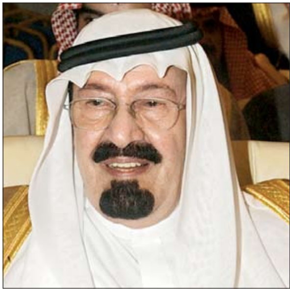
خادم الحرمين الشريفين الملك عبدالله بن عبدالعزيز