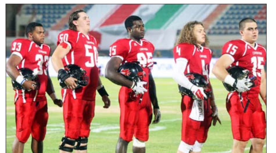
كندا تسعى إلى الاحتفاظ باللقب من بوابة أميركا

من جهته أكد نائب رئيس الاتحاد الآسيوي لكرة القدم الأميركية (أفأف) وعضو اللجنة الكويتية للعبة الشيخ مشعل طلال الفهد أن تنظيم الكويت لهذا الحدث العالمي يعتبر بحد ذاته إنجازاً والوصول لليوم الختامي للبطولة دون أي احتجاجات من قبل المنتخبات المشاركة خير دليل على حسن التنظيم على الرغم من أن البطولة تقام في شهر رمضان الكريم. وقال الفهد «الجميع عندما