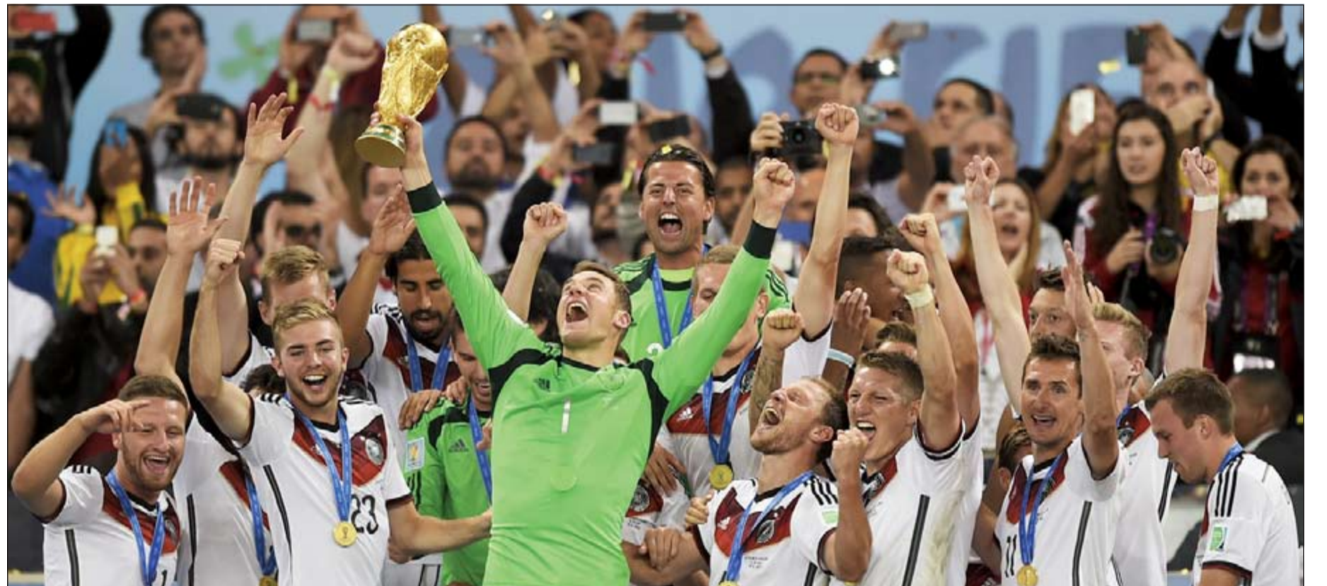
بطل العالم استحق اللقب عن جدارة

لقد فازت ألمانيا ببطولة كأس العالم هذه عن جدارة. فقد بعث الفريق برسالة قوية بالفعل منذ الأيام الأولى للبطولة عندما فاز 4-0 على البرتغال، ولكن ألمانيا بعد هذا الفوز حققت بعض الانتصارات المتقاربة، هذا بخلاف التعادل 2-2 مع غانا في مباراة حملت العديد من اللحظات المرعبة. ولكنني لم ينتهني أبداً ذلك الشعور بأن الأمور قد لا تسير على ما يرام، وبعدها جاءت النزوة خلال الفوز الذي لا يمكن تصوره بسبعة أهداف لهدف واحد أمام البرازيل، عندما تخلص الألمان من جميع قلوبهم، وذلك في البرازيل، من