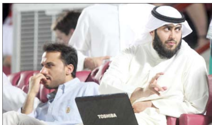
الشيخ مشعل طلال الفهد يتابع المباريات

تتحرك» ودعا الفهد الجماهير إلى حضور هذا المحفل العالمي ومشاهدة المباراة النهائية من أرض الملعب.