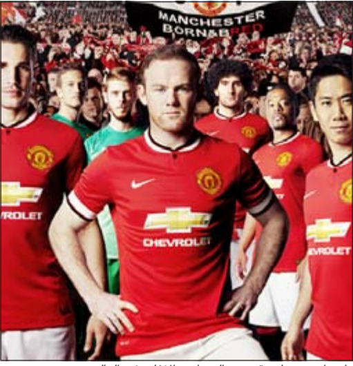
«أدياس» جعلت قميص يونايتد الأعلى في العالم

مان يونايتد يوقع عقدًا قياسياً مع «أدياس»