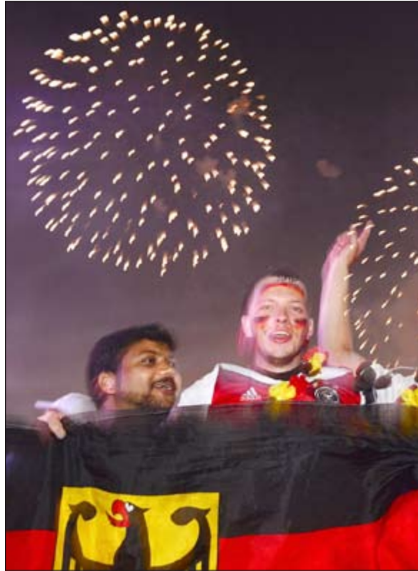
فرحة ألمانيا عارمة للظفر بكأس العالم

كان مشهداً حرك العالم بأسره، وكان فريق البلد المضيف، أحد أبرز المرشحين لإحراز اللقب، وهو الوحيد الذي لم يتمكن من الصمود للنهائية رغم كل الحماض الشديد الذي أحاط به. كان الضغط عليهم عظيماً بكل بساطة، هذا بالإضافة إلى سوء الحظ الذي واجهه منتخب الساميا بإصابة النجم نيمان، ولكن هذا لا يمكن اعتباره نهاية الكرة البرازيلية، فانا واثق من أننا بعد أربعة أعوام أخرى، سنرى في روسيا منتخبا برازيليا مختلفا تماما».