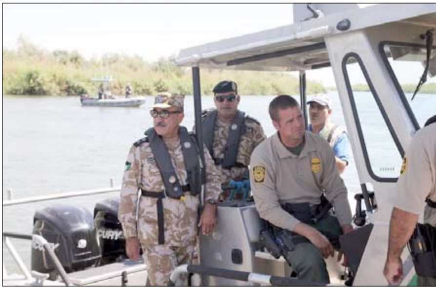
اليوسف خلال تفقده الحدود الأميركية - المكسيكية

استقبل قائد قطاع الحدود الأميركي جومي ووفورد، وكيل وزارة الداخلية المساعد لشؤون أمن الحدود اللواء الشيخ محمد اليوسف في مقر قيادة قطاع «يومًا» المخازي للحدود المكسيكية. وتم تقديم شرح تفصيلي عن طبيعة العمل بالحدود لديهم وماهي المعوقات التي تواجههم أثناء تادية عملهم. وبعد ذلك قام اللواء الشيخ اليوسف بزيارة الحدود ومشاهدة المعدات والآليات المستخدمة في حماية الحدود واستمع لشرح واف عن الأساليب المتبعة لضبط عمليات التسلل والتهريب والجهود المبذولة في هذا الشأن.