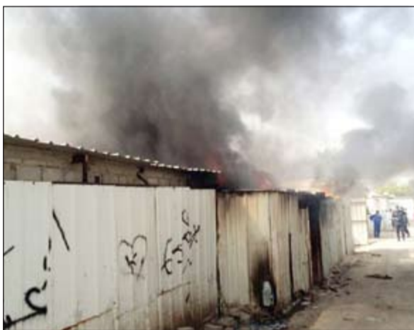
النيران كادت أن تتشعب إلى منازل مجاورة