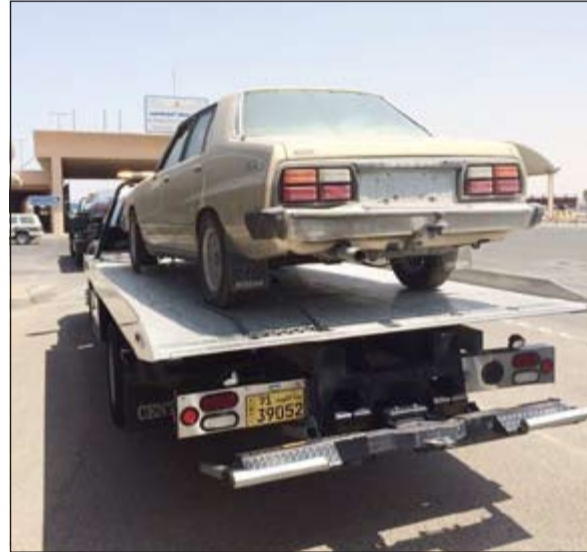
السيارات ذات اللوحات الخليجية إلى «الأبعاد»

هذا، وشرعت وزارة الداخلية في ترجمة تعليمات الوكيل المساعد لشؤون المرور حيث تم امس ارسال 3 سيارات ضبطت مؤخرًا في حملة الارتال وأصحابها يستهترون بها، حيث نقلت المركبات الثلاث برفاعات حتى الحدود على أن يتسلمها أصحابها ومن ثم يتوجهون بها إلى بلدانهم. وأكد المصدر ان هذا الإجراء سيشطب على كل مركبة يتم ضبط صاحبها يستهتر بها، حيث لن تسمح وزارة الداخلية بأن تتواجد