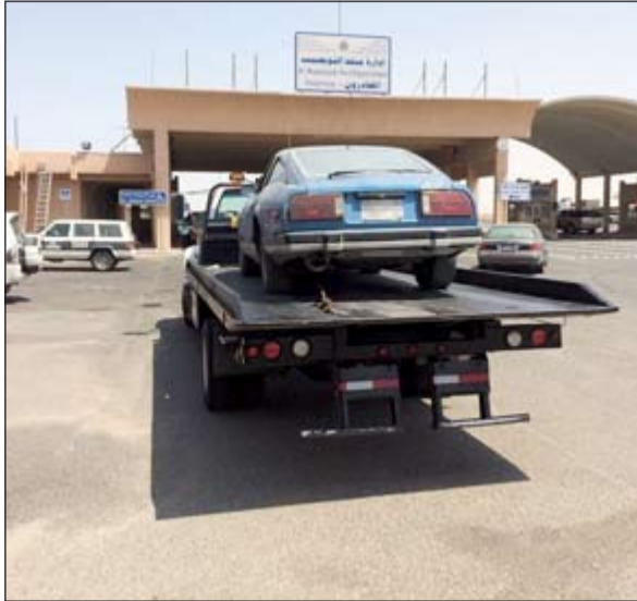
.. وسيارة أخرى ضبطت في حملة الارتال في طريقها إلى خارج البلاد

هذه المركبات في البلاد. وحول مصير ملكي هذه المركبات وإذا ما كان الأبعاد يقتصر على المركبات دون أصحابها اكتفى المصدر بالقول: ميدنياً سنسحب المركبات، وكل شيء وارد مستقبلًا. لاسيما أن الاستهتار والرعونة يشكلان خطورة بالغة على مستخدمي الطريق وأشار المصدر إلى أن جميع السيارات التي سوف تعود لن يسمح بدخولها البلاد حيث سيتم وضع بيانات تلك المركبات على قوائم المنع.