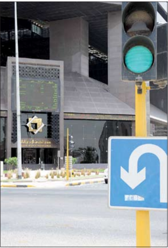
السوق يغير مساره نحو الارتفاع.. فهل أصبح طريقه «أخضر»؟

● استمرار نسبي للأوضاع على المستوى السياسي، مازال من الأمور الإيجابية التي يتمتع بها سوق الكويت المالي في الوقت الراهن.