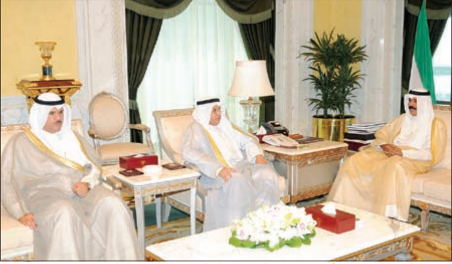
سمو ولي العهد الشيخ نواف الأحمد خلال استقباله الشيخ خالد الجراح والشيخ سلمان الحمود

الاحمد في ديوانه بقصر السيف امس رئيس مجلس الأمة مرزوق علي الغانم. واستقبل سموه بقصر السيف امس سمو رئيس مجلس الوزراء الشيخ جابر المبارك. كما استقبل سمو ولي العهد بقصر السيف امس النائب الاول لرئيس مجلس الوزراء ووزير الخارجية الشيخ صباح الخالد. واستقبل سموه بقصر السيف ظهر امس نائب رئيس مجلس الوزراء ووزير الدفاع الشيخ خالد الجراح. واستقبل سموه بقصر السيف ظهر امس وزير الإعلام ووزير الدولة لشؤون الشباب الشيخ سلمان الحمود. كما استقبل سموه حفظة الله بقصر السيف ظهر امس وزير الدولة لشؤون مجلس الوزراء ووزير العدل بالوكالة الشيخ محمد العبدالله.