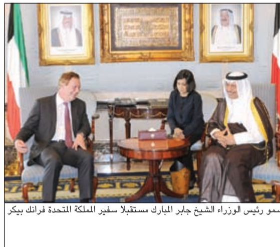
سمو رئيس الوزراء الشيخ جابر المبارك مستقبلا سفير المملكة المتحدة فرانك بيكر

وقى هذا السياق، قال عبد الرضا الكلاف وهو احد أولياء الامور نحن مجموعة من أولياء الامور قد سبق ان قدمنا الى وزارة التربية طلبات استرحام لأبنائنا وبناتنا بناء على طلب الوزارة رغم ان هناك من بناتنا من رسب بسبب شيء بسيط والوزارة طالبتنا