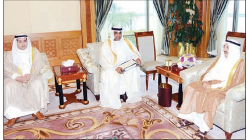
صاحب السمو الامير الشيخ صباح الاحمد لدى استقباله المستشار عبدالرحمن التمش ورياض الهاجري

مع كل السلطات محترمة استقلال كل منها وان تلك الأوتة بحاجة لمزيد من التخطيط والدراسة الواعية والتحرك الواسع على المستوى الدولي لمواجهة كل الاخطار المحيطة وبذل ما في الوسع لرفع المعاناة عن غرة ومحاولة التوصل لحل سلمي توقف نزيف الدماء والاعتداء على الاجرياء.