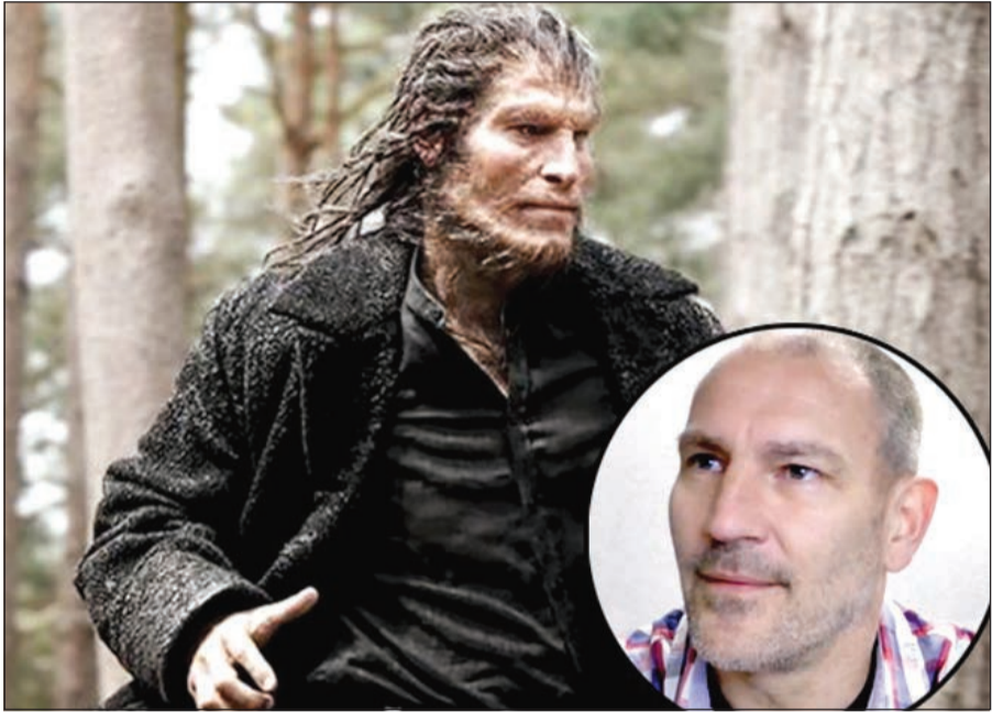
صورة مدمجة للممثل الراحل ديفيد ليجينو ولقطة من فيلم «هاري بوتر»

الولايات المتحدة وتناهنز فيها الحرارة الخمسين درجة مئوية صيفا. ولا تزال الشرطة تحقق في أسباب الوفاة، لكن يبدو أنها ناجمة عن أسباب طبيعية. وقد عثر شخصان على جثة الممثل في المنتزه. وقد تعذر على وكالة فرانس برس الاتصال بالناطق باسم الشرطة.