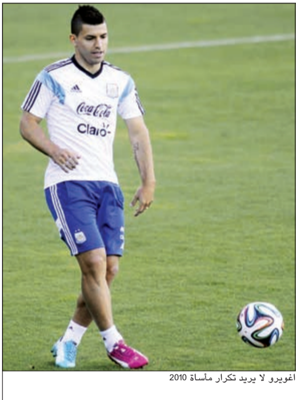
اغويرو لا يريد تكرار مأساة 2010