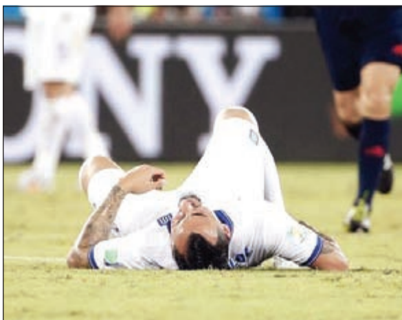
إصابات اللاعبين تشغل بال الكثيرين

وتابع «اللاعبون يتعاونون معنا بشكل أكبر ويحترمون قراراتنا». واستطرد «اجملاً نحظى باحترام كبير وهذه هي الرسالة التي يتعين علينا أن