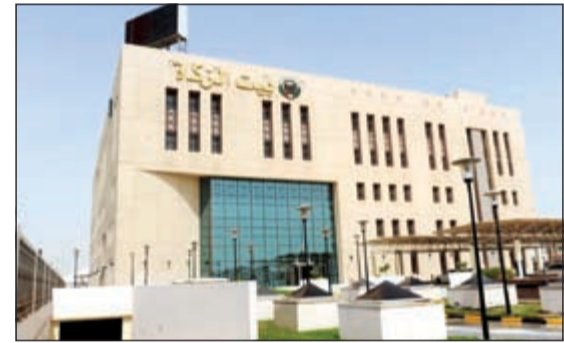
مبنى بيت الزكاة

من فتاوى ندوات قضايا الزكاة المعاصرة زكاة مكافأة نهاية الخدمة والراتب التقاعدي: