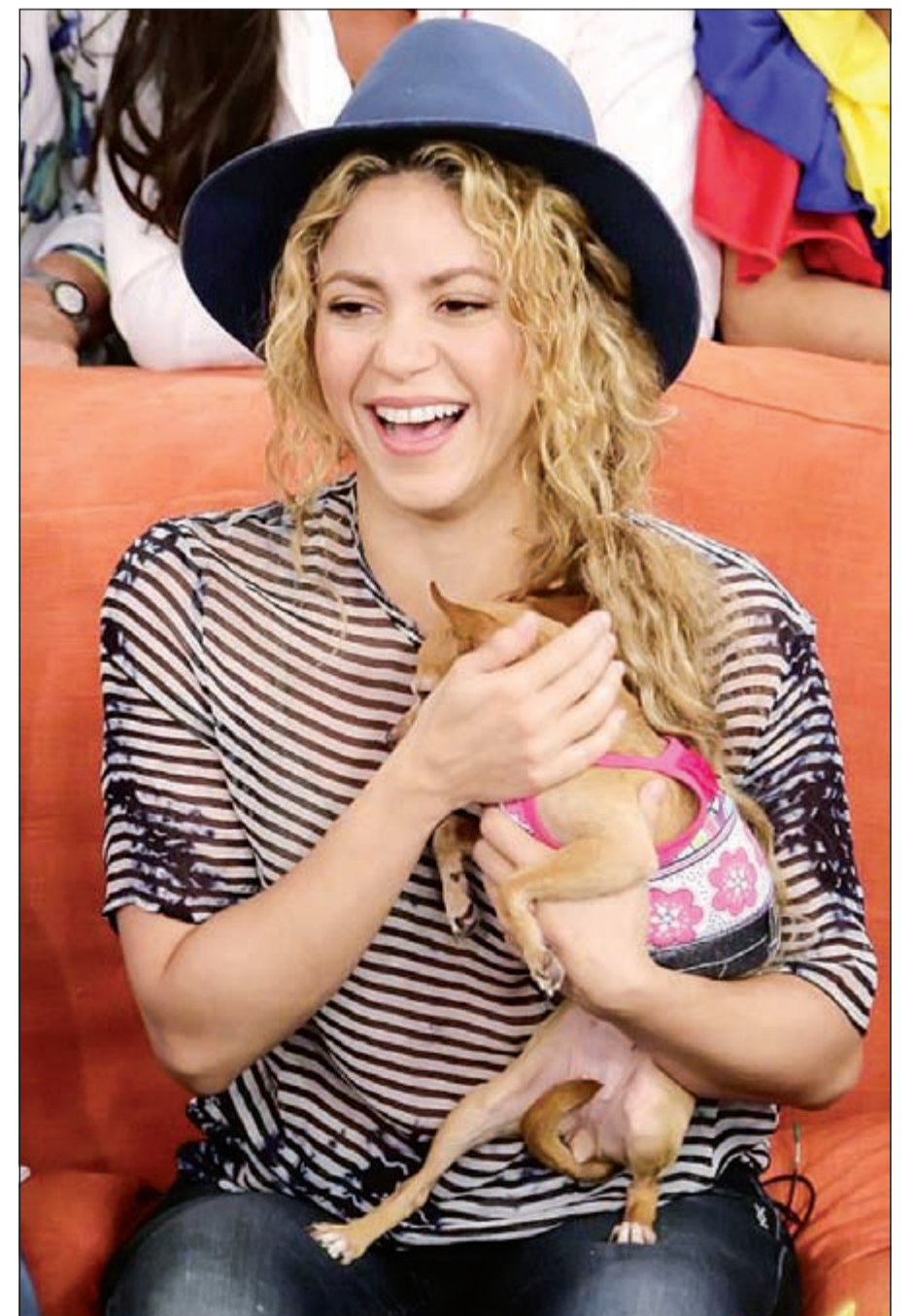
شاكيرا مع كلبها