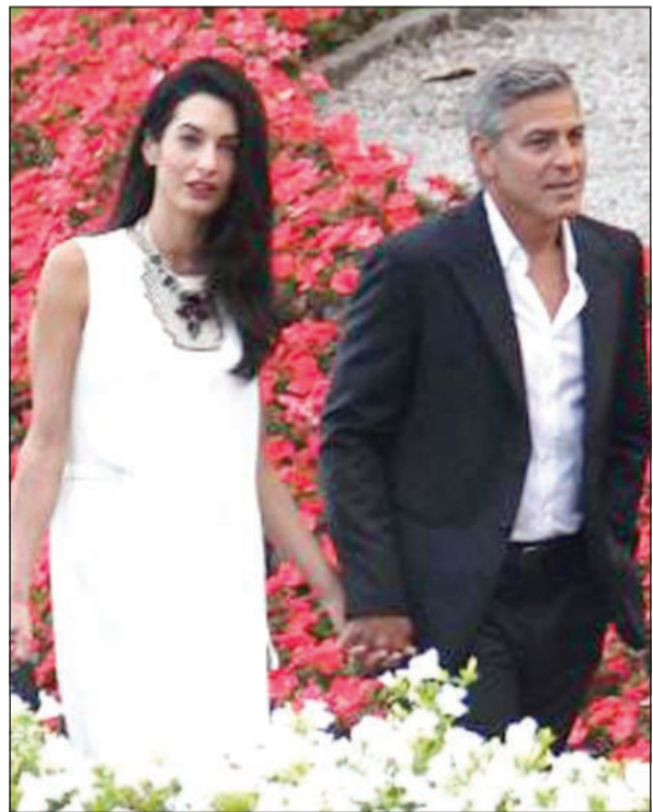
كلوني وعلم الدين

ورد كلوني في بيان نشر في صحيفة «يو أس توداي» أن حماته ليست من الدروز وأنها لم تذهب لبيروت منذ أن أعلن هو وأمل خطبتهما. وأضاف أنه اعتاد «على» فبركة ديلي ميل للقصص، «موضحا» هم يفعلون ذلك