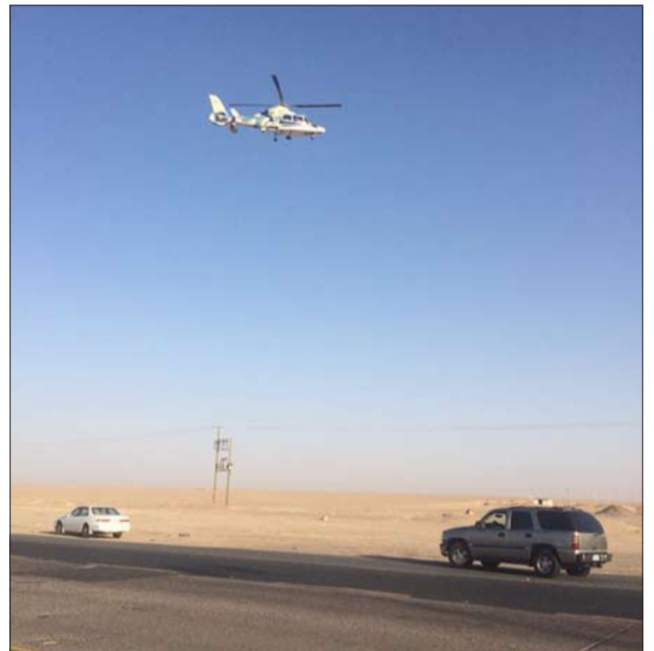
الطيران العمودي تابع الحملة منذ بدايتها