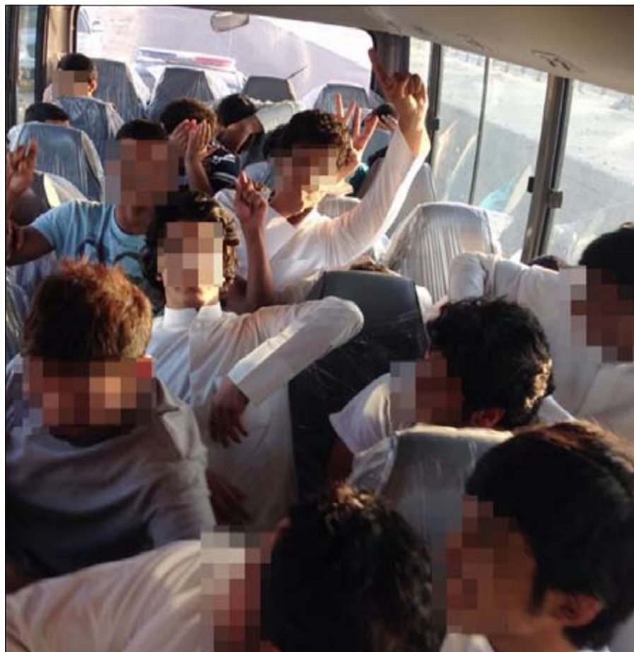
المستهترون إلى النظارة