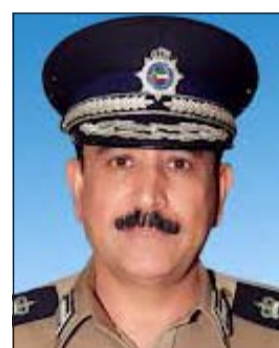
اللواء عبدالله المهنا