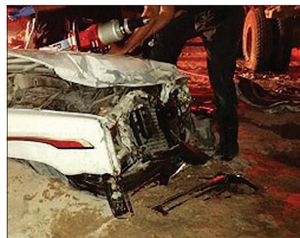
الوانيت وقد غمره الرمال بعد الحادث

بجانب رجال الإطفاء رجال الأمن والطوارئ الطبية. لقي واقد آسيوي مصرعه فجر أمس وأصيب شخص آخر في حادث تصادم على طريق الفحيحيل مقابل مركز إطفاء