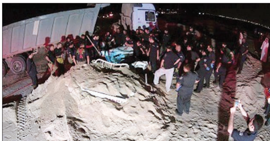
النساء وقد انقلب وتناثرت الرمال على طريق رحية

أنفاسه بينما أصيب السائق بإصابات متفرقة نقل على أثرها للعلاج في مستشفى العدان، وتم تسليم الجثة للأدلة الجنائية، وتواجد في الموقع رجال الأمن والطوارئ الطبية.