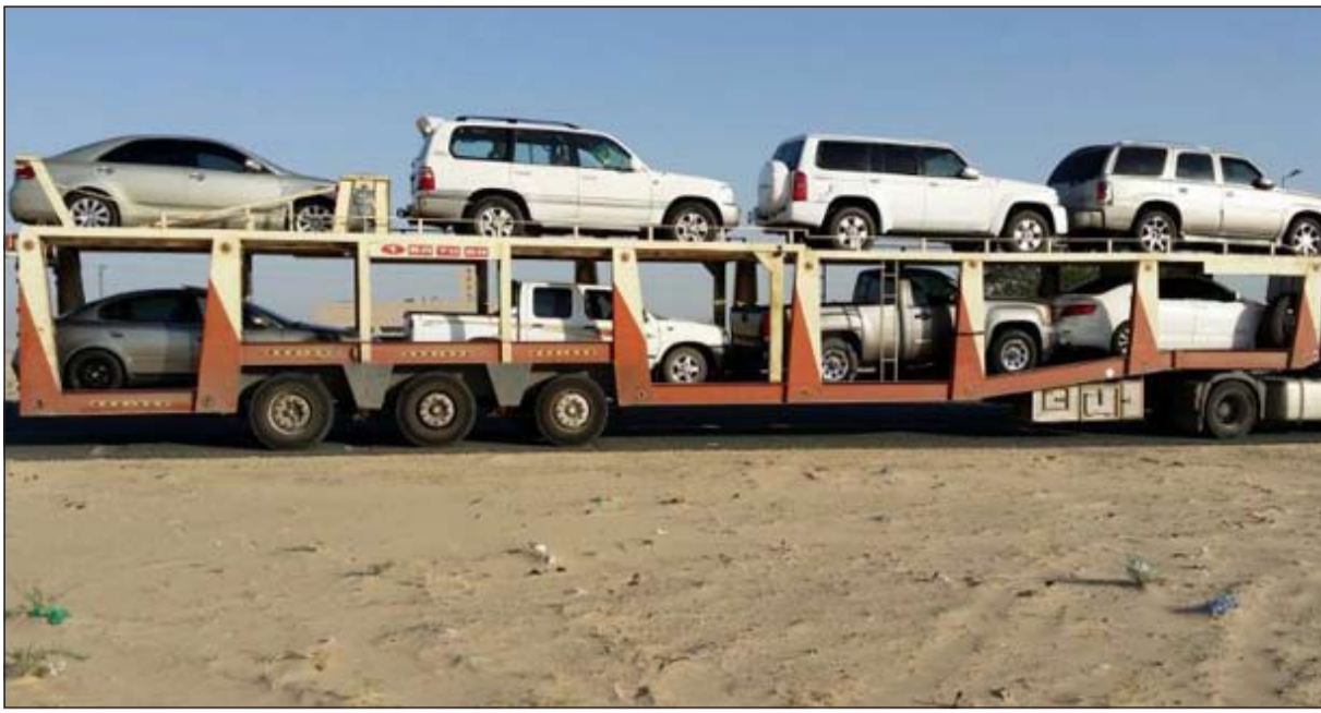
مركبات المستهترين إلى كراج الحجز