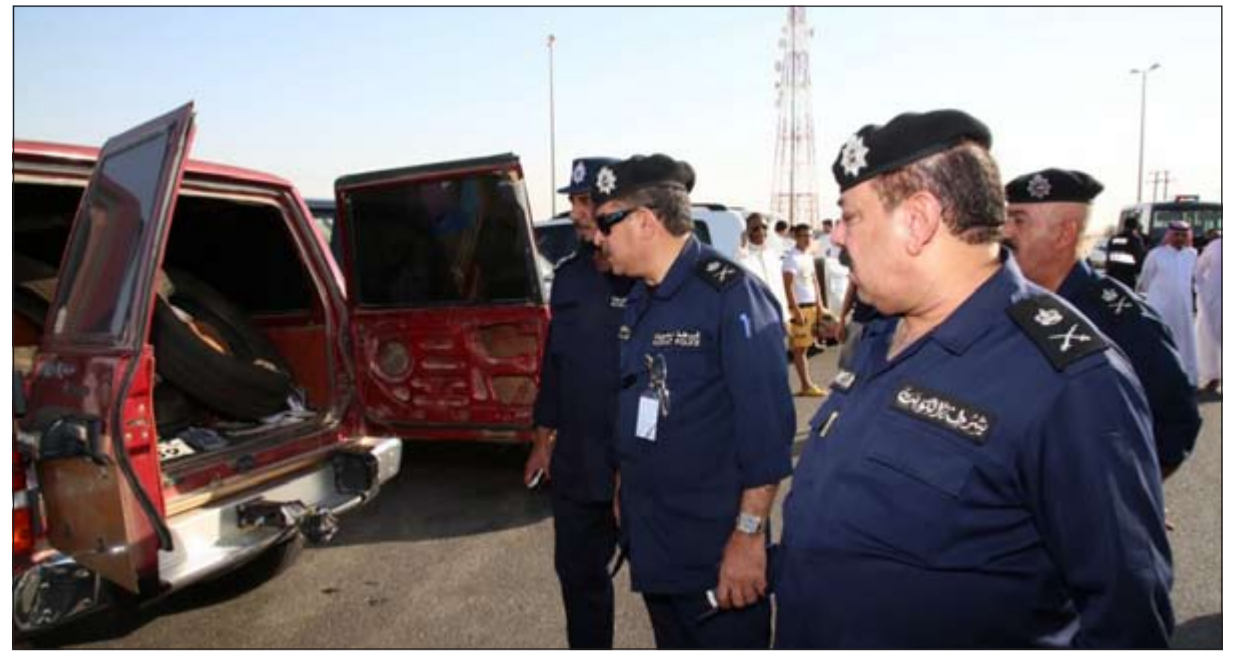
الحملة الموسعة أقيمت تحت إشراف اللواء عبدالفتاح العلي واللواء عبدالله المهنا واللواء جمال الصايغ