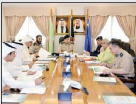
الفهد مترشعا اجتماع المجلس الأعلى للمرور