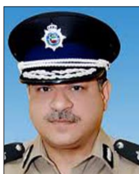
اللواء جمال الصايغ