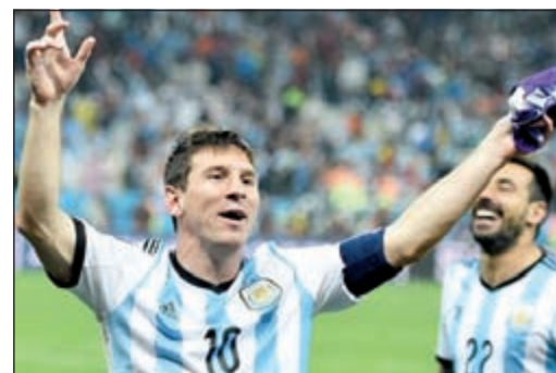
ميسي يواصل تحطيم الأرقام

كسر نجم هجوم برشلونة ومنتخب الأرجنتين ليونيل ميسي، رقم مواطنه أسطورة كرة القدم ديفغو أرماندو مارادونا، بعدما خاض مباراته الـ92 الدولية مع التانغو خلال مواجهة هولندا في إطار منافسات المربع الذهبي لمونديا البرازيل، في ملعب كورينثيانز. ورفع ميسي بحسب شبكة «أوبتا» الخاصة بإحصائيات كرة القدم رصيد مبارياته الدولية مع منتخب بلاده إلى 92 مباراة دولية متفوقا على مارادونا صاحب الـ91 مباراة مع كتيبة التانغو، ليواصل نجم برشلونة تحطيم الأرقام القياسية في عالم الساحرة المستديرة.