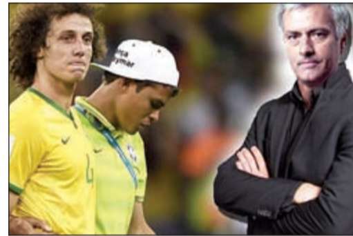
مورينيو مطلوب لتدريب البرازيل

واصلت الصحافة البرازيلية توجيه اللوم والنقد للمدير الفني فيلبي سكولاري وذلك بعد الهزيمة المذلة من المنتخب الألماني في نصف نهائي بطولة كأس العالم، وطالبت وسائل الإعلام بضرورة رحيل المدير الفني عن قيادة راقصي السامبا بعدما فشل في التأهل للمباراة النهائية التي كانت بمنزلة الحلم لجماهير الكرة البرازيلية.