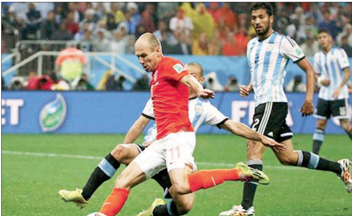
روبين يتحسر على الخروج