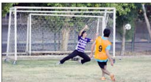
ركلة جزاء صائغة

واصل فريق البلوز زحفه نحو الأدوار النهائية في دورة بدر فارس الخرينج الرمضانية الأولى لكرة القدم التي تقام على الملاعب الفرعية ببنادي الساحل، اثر تفوقه مساء أول من أمس الأربعاء على ملك الباناشي 3-1، فيما اكتسح الواضح منافسه الملوك برياعية نظيفة، وتأهل برشلونة إلى الدور المقبل بعد انسحاب سباهي، في حين سقط الظاهرة امام فريق المرحوم مساعد الدوسري بنتيجة 1-2. وفاز فريق المرحوم ناجي ثريان على نظيره رفلكشينز ميديا 5-4 بركلات الترجيح، وفريق المرحوم سعد العازمي على الملك 2-0، والمدفعية على فريق المرحوم محمد غلوم 3-1، بينما حسم سعد عقيل لقاء مع الكماشة بركلات الترجيح 5-4.