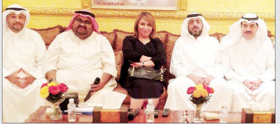
أعضاء قائمة التغيير