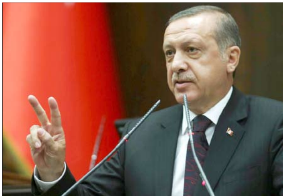
رجب طيب أردوغان خلال القائه كلمة امام نواب حزبه بالبرلمان في أنقرة امس الاول (ا.ف.ب)

بل كانت تستهدف تركيا، وإزكاع الشعب التركي»، مضيفا «إن قدر لي أن أكون رئيسا للبلاد، فستأمر في مكافحة مثل هذه الأنظمة، والكيانات». وعن الانتخابات الرئاسية المقبلة قال أردوغان «الشعب التركي سيختار رئيسه يوم 10 أغسطس المقبل، وهذه الانتخابات ستكون شاهدة على نهاية فترة في تاريخ تركيا، وبداية فترة أخرى». وتابع «الانتخابات الرئاسية المقبلة ليست النهائية بالنسبة لنا، بل هي بداية سنواصل من خلالها تقديم الخدمات للشعب التركي، والبلاد تحت مسمى، وشكل جديدين»، مشيرا إلى أنهم «استلهموا أفكارهم خلال السنوات الـ 12 الأخيرة في مجال خدمة البلاد، من عدد من الشغراء، والأدباء، والعلماء الأتراك». وأكد رئيس الوزراء التركي أن حزبه لم يهاب الوصاية التي كانت مفروضة على البلاد من قبل، لافتا إلى أن حزب العدالة والتنمية استطاع خلال الفترة الماضية، التغلب على كل الصعاب، وتجاوزها بدعم الشعب التركي، «حتى تبسر لنا تحقيق التقدم للبلاد في كل المجالات، لاسيما المجال الاقتصادي، في فترة لم يكن يرغب أحد فيها تقدمها».