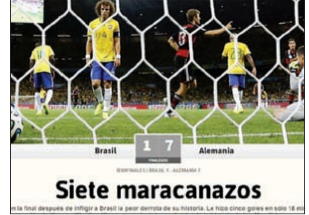
«أس» الإسبانية لم ترحم أيضا البرازيل