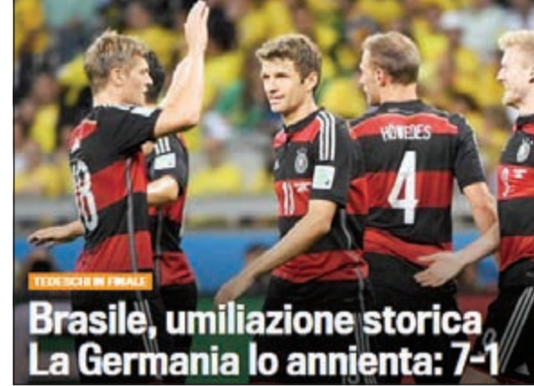
«اوليه الأرجنتينية» فرحة بسقوط الجار