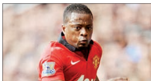
جماهير يوناتيد تقترب من توديع إيفرا

أفادت صحيفة الميرور البريطانية بأن باتريس إيفرا لاعب سان يوناتيد قد وافق على انتقاله لنادي يوفنتوس الإيطالي وذلك بعد توقيع عقد مدته عامين مقابل 1,2 مليون أسترليني. ويتضمن العرض بقاء عامين مع البطل الإيطالي، حيث سيستعاطي الظهير الأيسر مرتبا قيمته 55 ألف أسترليني اسبوعيا، وهو ما يعتقد أنه أفضل من مرتبه الحالي مع اليوناتيد، بالرغم من تجديده للشياطين الحمر مؤخرا لمدة عام. ومع وصول لوك شو من ساوثهامبتون، يبدو أن إيفرا سيخسر مكانه الأساسي في تشكيل الفريق الأحمر، وهو ما شجعه على الانتقال لليوفي، حيث سيمكثه ذلك من المشاركة في دوري أبطال أوروبا. النادي قد أراد أن يضمن خدمات اللاعب لعام آخر، لكن يبدو أن زوجة إيفرا صاحب الـ 33 عاما كانت قد قررت بالفعل الانتقال من إنجلترا.