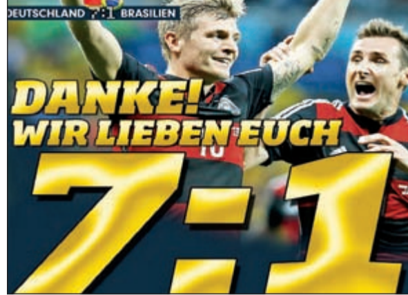
صحيفة بيلد الألمانية تتباهى بإنجاز المانشافت