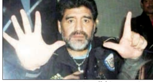
وين يترواحون من تعليقات ديبغو؟

تداول نشطاء مواقع التواصل الاجتماعي صورتين للنجم الأرجنتيني ديبغو مارادونا، وقالوا إنه يسخر من هزيمة البرازيل أمام ألمانيا 7/1 في قبل نهائي كأس العالم. وفي إحدى الصورتين يرفع مارادونا يديه برقم سبعة، تعبيرا عن عدد الأهداف التي سجلت في مرمرى السامبا. كما نشرت صفحة على موقع التواصل الاجتماعي «تويتر» منسوبة لمارادونا صورة أخرى تحمل عبارة «كنت أعرف» تعبيرا عن توقعه بهزيمة البرازيل أمام ألمانيا. يشار إلى أن مارادونا يقبع في الإمارات حيث يعمل «سفيرا للرياضة» لإمارة دبي، وينشر بعض التعليقات على بطولة كأس العالم في صحف إماراتية.