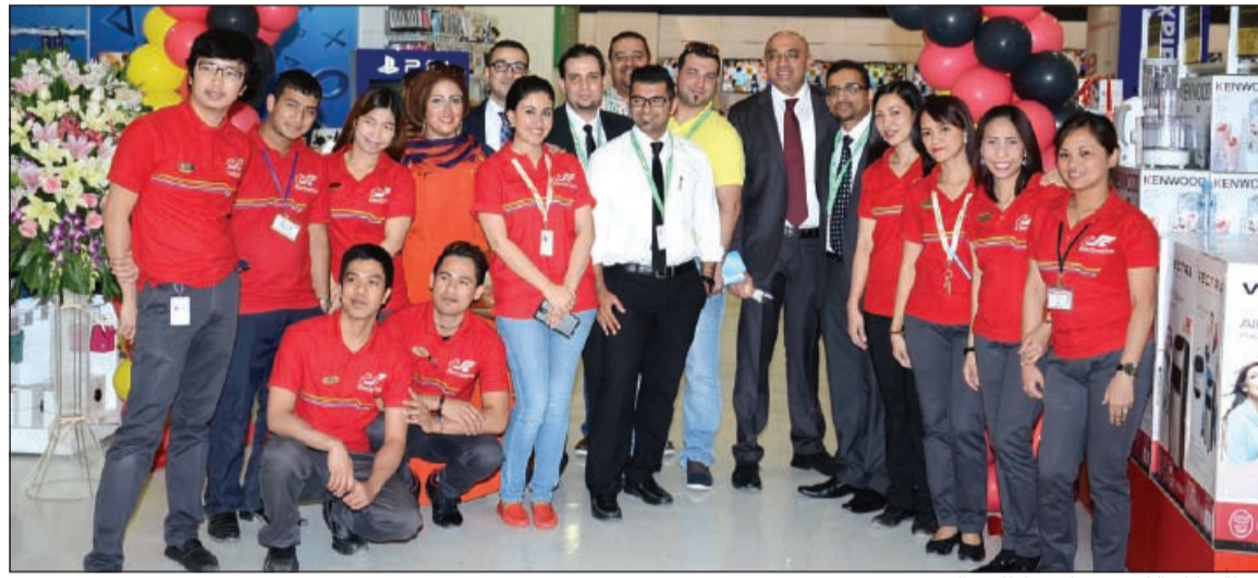
لقطة تذكارية لفريق مركز سلطان - الشويخ

يوفر مركز سلطان لعملائه فرصة شراء المنتجات الإلكترونية باستخدام خدمات مستفيدين من خدمات