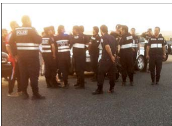
حملة امس جاءت بالتنسيق بين النجدة والامن العام