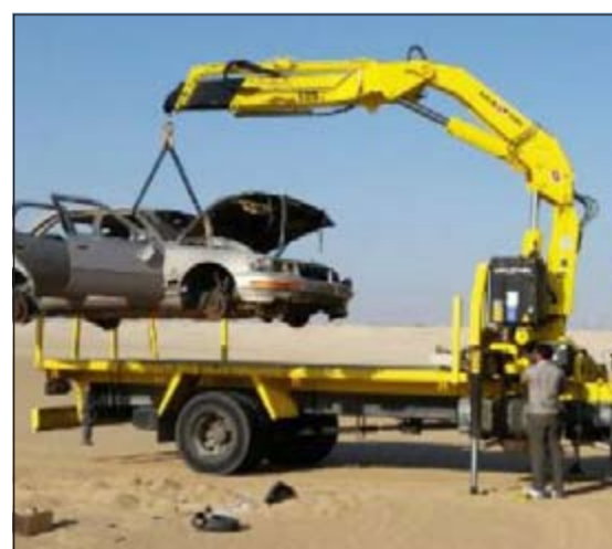
سيارة مخالفة في طريقها إلى كراج الحجز

الشباب المستهترين وحجز سياراتهم بالإضافة الى تحرير المخالفات المرورية. هذا، وقد شارك بالحملة قطاع المرور والنجدة، وقال مصدر امني ان الحملة انطلقت بعد صلاة فجر امس واستهدفت طريق الارتال المطل على طريق السالمي بمشاركة اكثر من 22 دورية من قطاع الامن العام والمرور والنجدة، وفور وصول الدوريات الى موقع التجمهر فر قائدو المركبات وأنفأ فرارهم انقلبت مركبتان دون ان تلحق بقائدي السيارات اصابات بالغة، وتم رفع تقرير بالواقعة وتحرير محضر بالسيارات