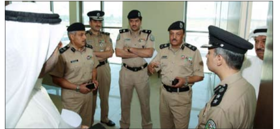
اللواء عبد ابوصليب واللواء الشيخ مازن الجراح خلال تقديمهما مبنى الهجرة

اللازمة لتشغيل المبنى فور الانتقال الىه من المبنى المستأجر حاليا والذي سيتم تسليمه للمالك فور الانتقال. وأكد اللواء د. أبو صليب أن قطاع الخدمات المساندة وبدعم من معالي نائب رئيس مجلس الوزراء ووزير الداخلية ووزير الأوقاف والشؤون الإسلامية بالإمانة الشيخ محمد الخالد، ووكيل وزارة الداخلية الفريق سليمان فهد الفهد يسعى جاهدا للحد من الاعتماد على المياني المستأجرة، وذلك من خلال خطة موضوعة يتم تنفيذها على مراحل متتالية.