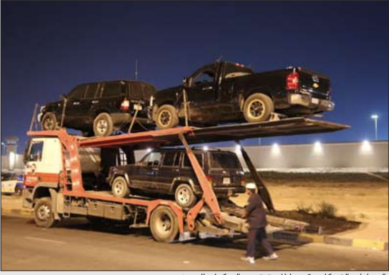
السيارات التي كان يقودها المستهترون إلى كراج الحجز

بسرعة عالية وصعود وتخطي الأرصفة واتلاف المرافق العامة والقيادة عكس السير وإثارة الغبار والأتربة والإشارة بالأضواء العالية، الأمر الذي أثار الخوف والفرع في أرجاء المنطقة وشكل تهديدا للأرواح والممتلكات. وأشار الإعلام الأمني إلى ان المتهمين الستة رباعية الدفع في القيادة برعونة واستهتار وتعريض حياة الأهالي والمشاركين في المسيرات غير المرخصة والمخالفة للقانون التي شهدتها منطقة صباح الناصر الاثني الماضي للخطر الداهم وكادوا ان يتسببوا في حوادث تصادم مروعة ودهس يروح ضحيتها الأبرياء بسبب الرعونة والاستهتار والقيادة