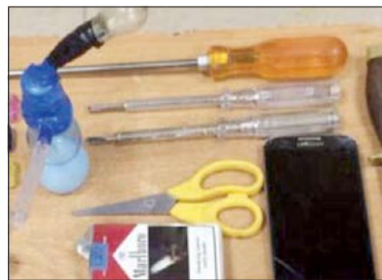
ادوات تعاط وأخرى حادة ضبطت في الحملة