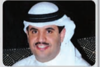
راعي المهرجان الشيخ دعيج الخليفة الصباح