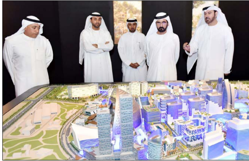
الشيخ محمد بن راشد يطلق مشروع «مول العالم» أكبر مركز تسوق في العالم في الوقت الذي أطلق فيه صندوق النقد الدولي تقريراً يؤكد قدرة دبي على تمويل ديونها لكن الإمارة ستظل مهددة في حالة حدوث تباطؤ اقتصادي عالمي شديد (أ.ق.ب)

من الارتفاع السريع لأسعار العقارات في دبي قائلًا إن السلطات اتفقت مع الصندوق خلال المناقشات على أنه قد تكون هناك حاجة لفرص رسوم أعلى تستهدف فئات معينة لكبح الطلب على العقارات بهدف المضاربة. وتابع الصندوق أن حكومة دبي أشارت إلى أنها ستستخذ مشروعات عقارية ومشروعات بنية تحتية كبرى بالتدريج وأن خطتها ستكون مرنة ومتماشية مع توقعات النمو السكاني. ومن المتوقع أن تسجل ميزانيتها حكومة دبي فائضاً بسيطاً قدره 0.5% من الناتج المحلي الإجمالي في 2014 وهي المرة الأولى التي يتحقق فيها فائض منذ عام 2006 ومقارنة مع عجز 0.3% في العام الماضي.