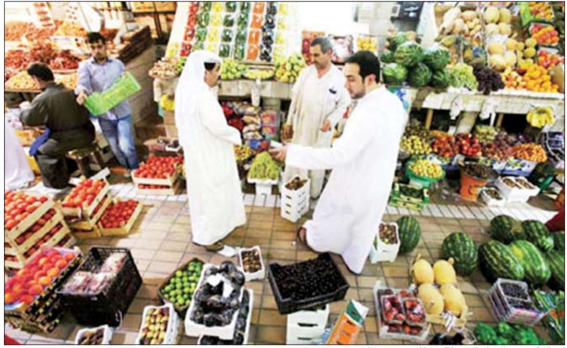
ارتفاع كبير في الإنفاق الاستهلاكي خلال شهر رمضان

قال تقرير الشركة الكويتية - الصينية الاستثمارية أن الأسواق المالية أصدرت العديد من التوقعات على ميزانية الهند القادمة التي ستعلن عنها حكومة رئيس وزراء الهند ناريندرا مودي في 10 يوليو. وقد أعطى الانتعاش الكبير في الانتخابات أملا للمستثمرين في أن الحكومة ستعيد تنظيم القوانين التي تعوق النمو التجاري في الهند، حتى في ظل العجز المالي والتضخم المستمر. وقد تم تسجيل 46% من إجمالي العجز المالي المتوقع للسنة المالية المنتهية ما بين أبريل 2014 ومارس 2015 خلال شهري أبريل ومايو من هذا العام فقط. وهذا يتطلب وضع القيود التي تحتاجها الحكومة على الإنفاق، مما يترك مجالاً صغيراً لأي إجراءات شعبية في غير محلها. ويمكن للحكومة أن تأخذ طريق التخرج من الاستثمارات لتعزيز احتياطياتها من خلال بيع حصتها في مؤسسات القطاع العام. كما أن الاقتصاد يعاني كثيرا من مستويات التضخم العالي التي تقارب 8%، وهو ما أبقى البنك المركزي مقيدا. لهذا، لا يؤخذ تخفيض أسعار الفائدة بعين الاعتبار على الأقل على المدى القصير. وأشار التقرير إلى أن هذا يترك الحكومة مع إمكانيات محدودة، ومعظمها في شكل إصلاحات على جانب العرض، أي الإجراءات التي من شأنها تسهيل ممارسة الأعمال التجارية عن طريق خفض الشروط والقيود التنظيمية. وسيكون هذا في انتظار هذه الإجراءات ضمن الميزانية القادمة. فالسوق على استعداد لمنح الحكومة مهلة في خصوص العجز المالي، لأن الحكومة الجديدة قد ورثت اقتصادا ضعيفا من الحكومة السابقة.