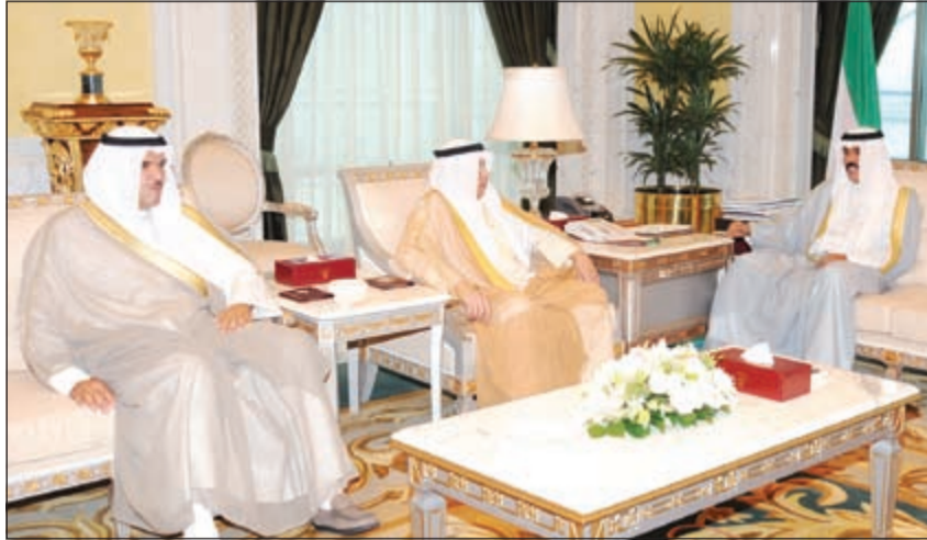
سمو ولي العهد الشيخ نواف الأحمد مستقبلاً الشيخ خالد الجراح والشيخ سلمان الحمد

استقبل سمو ولي العهد الشيخ نواف الأحمد في ديوانه بقصر السيف صباح أمس رئيس مجلس الأمة مرزوق الغانم. واستقبل سمو ولي العهد بقصر السيف صباح أمس سمو رئيس مجلس الوزراء الشيخ جابر المبارك. كما استقبل سمو ولي العهد النائب الأول لرئيس مجلس الوزراء وزير الخارجية الشيخ صباح الخالد. واستقبل سمو ولي العهد نائب رئيس مجلس الوزراء وزير الشؤون الإسلامية بالوكالة الشيخ محمد الخالد. كما استقبل سموه بقصر السيف صباح أمس نائب