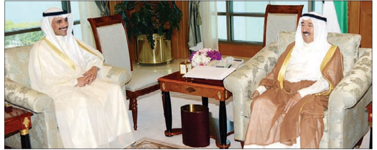
صاحب السمو الأمير الشيخ صباح الأحمد مستقبلاً مرزوق الغانم

وزير الإعلام ووزير الدولة لشؤون الشباب الشيخ سلمان الحمد. رئيس مجلس الوزراء وزير الدفاع الشيخ خالد الجراح. واستقبل سمو ولي العهد