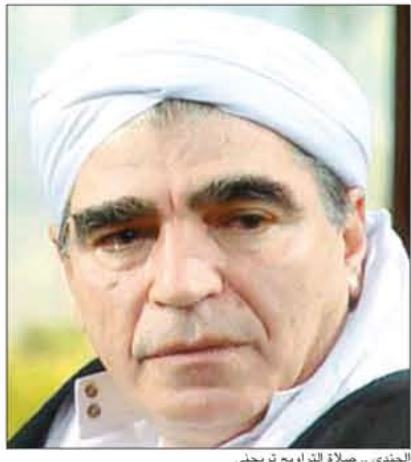
الجندي .. صلاة التراويح تريحه