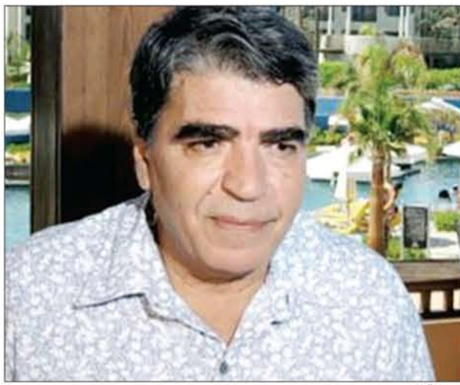
القاهرة - حمزة احمد

يتمتع الفنان القدير محمود الجندي بكاريزما عالية جدا ويكاد يكون الفنان الوحيد الذي شارك الزعيم عادل سلطوته وتجاهه الأسطوري في السينما ولا أحد يشي دوره في مسلسل دموع في عيون وقحة، فالجندي كان ولا يزال القاسم المشترك في أكبر أعمال نجوم السينما والدراما. وهذا العام يطل محمود الجندي على جمهوره بدور مميز يشبه أدواره التي خطلت الأبصار في مسلسل ابن حلال مع النجم الشاب محمد رمضان والذي يراهن من خلاله على جذب قطاع كبير من الجمهور بسبب تميز قصته والدراما المقدمة فيه. وحول طقوسه في رمضان يقول محمود الجندي ان ذكرياته مع رمضان مرت بعدة تحولات لافتة فقديمًا لم يكن يشعر بهذا الشهر ويمر عليه مثل أي شهر عمل وسهر ولا شيء آخر. أما الآن يقول الجندي انه يحرص الآن على الاستمتاع بكل دقيقة فيه ويستيقظ مبكرًا بعد الظهر للاستمتاع بقراءة القرآن الكريم قبل الإفطار وهي ساعات ثمينة جدا ثم تبدأ رحلة الاستعداد لتجهيز طعام الإفطار ويقول محمود الجندي انه لا يخجل من ان يدخل المطبخ لتجهيز عصير العرقسوس وبعض المشروبات وبعض الأطعمة التي يحب ان يصنعها بيديه.