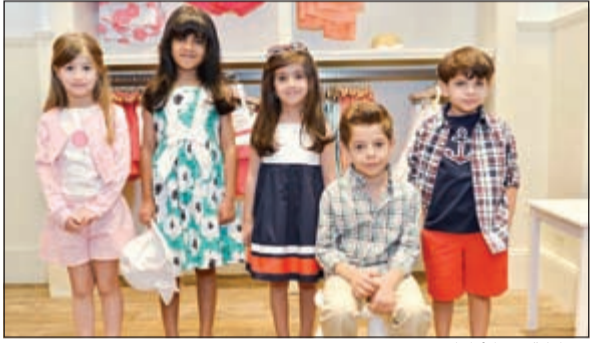
مشاركة من الأطفال

نظمت العلامة التجارية الرائدة لملايس الأطفال «جايني أند جاك» حفلاً لأطفال الإعلاميين في متجرها الكائن في مجمع الأفيونوز. حفلت المناسبة بالعديد من الفقرات الترفيهية تضمنت أشغالاً يدوية (أوريغامي) ورسمًا على الوجوه بالإضافة إلى مسابقة عرض أزياء للأطفال من الحضور كان محورها تصوير الأطفال بملايس «جايني أند جاك» وتحميل الصور على مواقع التواصل الاجتماعي وقد حصلت صورة الطفل الحائز على أكثر عدد من المعجبين على أطقم ملابس من المتجر، وأمضى