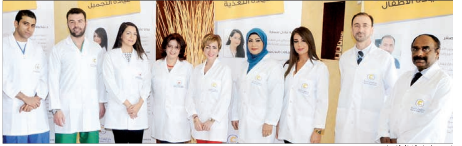
فريق عمل دار الشفاء كلينيك