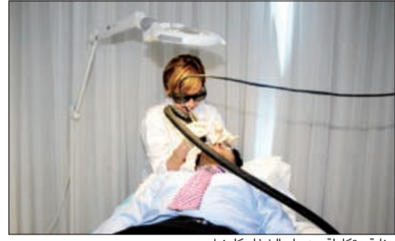
عناية متكاملة من دار الشفاء كلينيك