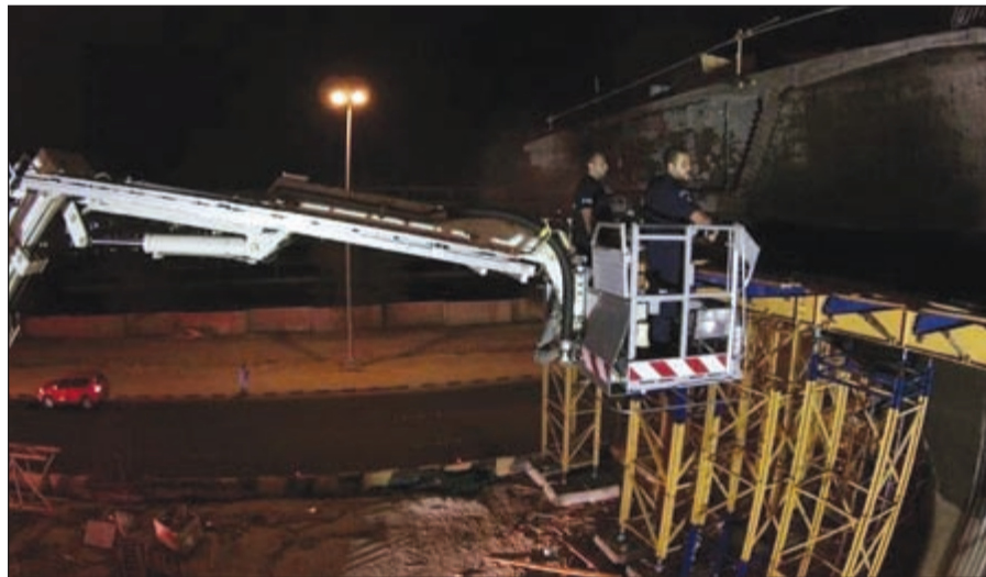
الإطفائيون تعاملوا مع حريق السقالة بسلام متحركة