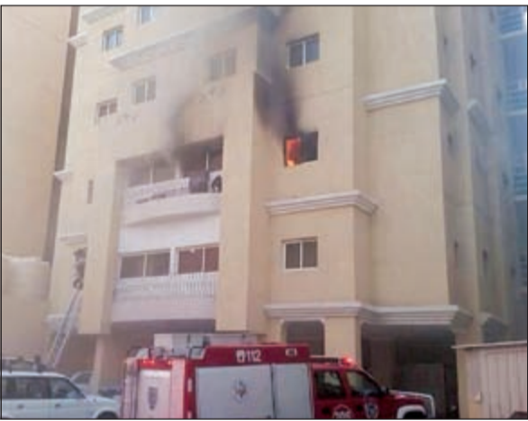
الدخان الكثيف والنيران تظهر بوضوح من النافذة