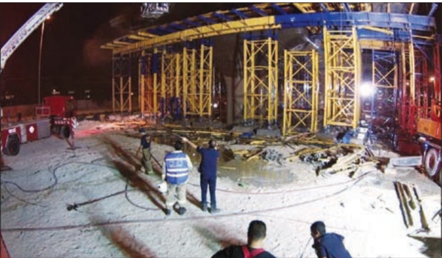
«الإطفاء» فتحت تحقيقات للوقوف على ملابس الحريق