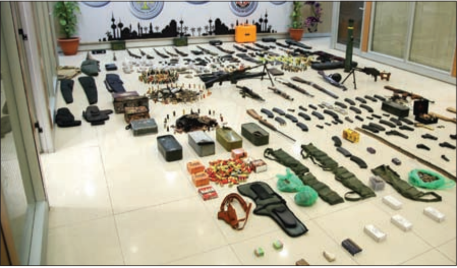
«الجناينة» كلفت من تحريباتها عقب مقطع مصور