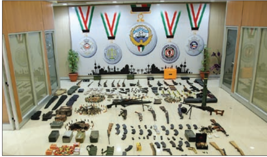
ترساة الأسلحة تنوعت بين رشاشات ومسدسات وذخيرة