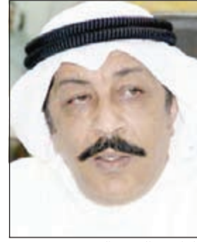
لواء عبدالحميد العوضي

نائب رئيس مجلس الوزراء ووزير الداخلية وزير الأوقاف والشؤون الإسلامية، بالإنابة الشيخ محمد الخالد، وبحضور وكيل وزارة