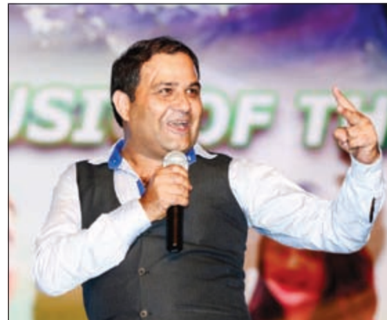
من أجواء الاحتفال