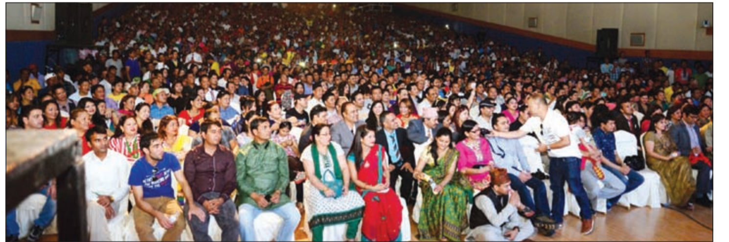
حضور كبير من أبناء الجالية النيبالية في الاحتفال