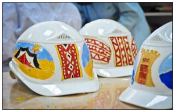
تنانج من أعمال طلبة مركز الكويت للتوحد

قامت وزارة الأشغال العامة بتكريم مجموعة متميزة من طلبة مركز الكويت للتوحد في حفل كبير بحضور وكيل وزارة الأشغال العامة م. عواطف الغنيم، حيث قام الطلبة بتقديم نموذج مشرف من القدرة والتحدى والحرفية والاتقان في العمل من خلال الأعمال الإبداعية الفريدة التي قاموا بها بتمثيل معالم ورموز الكويت على خوذ الأمسان والتي قدمت من قبل مسؤولي مشروع تطوير شارع جمال عبدالناصر ضمن برنامج المشروع للمسؤولية الاجتماعية الذي اطلق في شهر نوفمبر من العام الماضي تحت عنوان Helmets For a Cause او «خوذ السلامة المعبرة عن الخير»، وذلك بالتعاون مع مجموعة شباب الخير الكويتية والقائمين على مركز الكويت للتوحد والذين اشرفوا على أنشطة هذا البرنامج مع الطلبة مما ساهم في إنجاحه بشكل كبير، كما ساهم في إبراز مواهب الطلبة الاستثنائية في الفن التشكيلي، وقام بتزيين الوطنية في نفوسهم. من جانبها، قالت م. عواطف الغنيم: يعتبر برنامج خوذ السلامة المعبرة عن الخير واحد