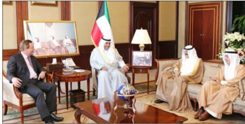
الشيخ صباح الخالد خلال استقباله سفير المملكة المتحدة فرانك بيكر بحضور خالد الجارالله والشيخ د. أحمد ناصر المحمد