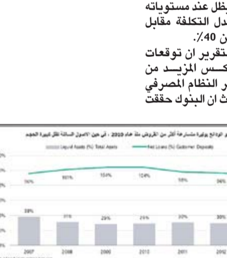
نمو الودائع بوتيرة سريعة أكثر من القروض منذ عام 2010

وذكر التقرير أن مؤشر الإنتاجية سيظل عند مستوياته الحالية بمعدل التكلفة مقابل الدخل أقل من 40٪. وذكر التقرير أن توقعات موديز تعكس المزيد من تطور معايير النظام المصرفي الكويتي، حيث أن البنوك حققت نمو 10٪.