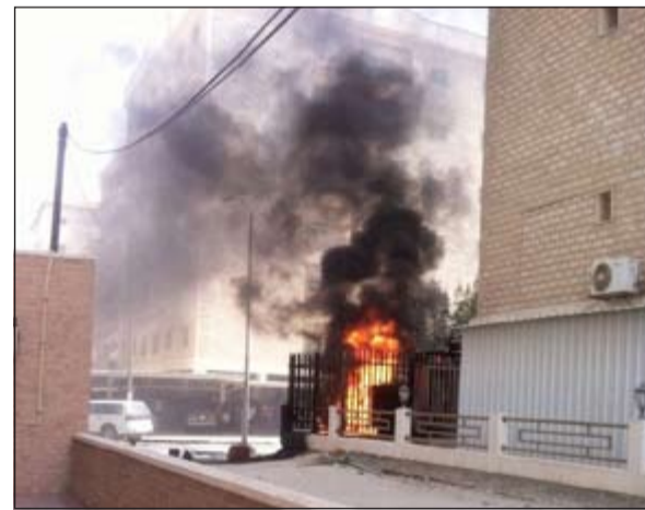
حريق المحول خلف سحبا دخانية