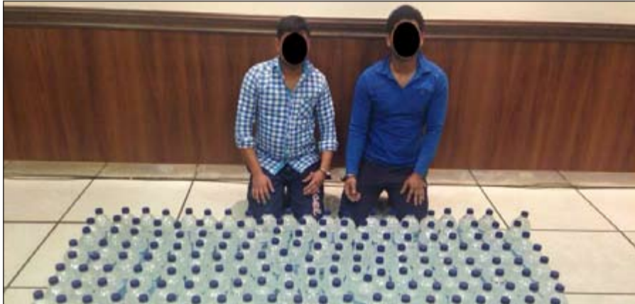
الآسيويان امام المضبوطات

أحال مدير امن محافظة الفروانية اللواء فرج الشمري الى الإدارة العامة لمكافحة المخدرات واثنين آسيويين بعد ان ضبطوا وبحوزتهما 175 بطل خمر محلية. وقال مصدر امني ان الفرقة الامنية بقيادة الملازم محمد السعيدى اشتبتهت بوافدين، ويتفتش المركبة التي كانا عليها عثر فيها على 175 بطل خمر محلية.