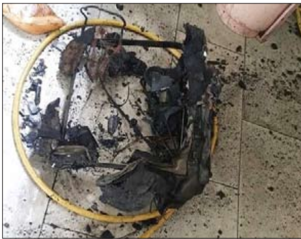
الحريق التهم ما قبله من مواد قابلة للاشتعال

والتقيب خالد العجمي، حيث قام رجال الإطفاء بالسيطرة على السنة اللهب ومحاصرتها قبل أن تنتشر العمارة كونها ملاصقة للمحول الكهربائي، هذا، ونصت عملية مكافحة الحريق دون وتسوع أي إصابات. من جهة اخرى، هرع رجال الإطفاء ظهر امس لحريق