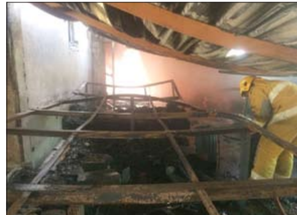
رجل إطفاء يعالين الحريق بعد إخماده

أجهزة كهربائية وأثانا تعامل معه رجال الإطفاء وتمت عملية إخماده بعد جهود مضنية كون المستودع مصنوعا من الكيربي وقد انهار بسبب الحريق، أما تفاصيل الحادث الثاني فقد اندلعت النيران في 3 شالبيات تستخدم كسكن للعامل وقد سيطر رجال الإطفاء على