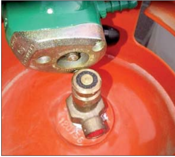
سلندرات الغاز يحذر العبث بها

أعلنت الإدارة العامة للمرور في افتتاح تحويلية بطريق جمال عبد الناصر مقابل دوار مستشفى الطب النفسي باتجاه منطقة الصليبخات وبالتراف مع إغلاق دوار مستشفى الطب النفسي لتركيب الجسر الجديد طبقا لمرحلة التالية: إغلاق جرتي لدوار مستشفى الطب النفسي للمتحجه لمدينة الكويت من 2014/6/29 إلى 2014/7/19 مع ابقاء طريق جمال عبد الناصر مفتوحا.