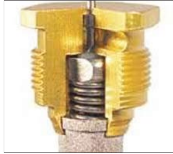
معدات تدفق الغاز تحدث كوارث