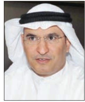
السفير منصور العتيبي

وأضاف ان الكويت «تلتزم أيضا بأن تساعد بشكل فعال في جهود التنمية في البلدان الأخرى من خلال توفير المساعدة الإنمائية الرسمية والتي بلغت 1,32٪ من الدخل القومي الإجمالي للفترة 2011-2012، وبذلك تجاوز