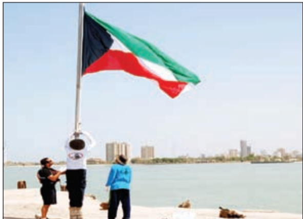
جانب من صيانة سارية علم الكويت

أنجز فريق الغوص التابع للمبرة التطوعية البيئية تبديل وصيانة سارية علم الكويت الذي رفع ضمن احتفالات البلاد بعيد الوطني وعيد التحرير هذا العام في جزيرة أم القاز أول جزيرة صناعية في البلاد وتقع شمال غرب أبراج الكويت.