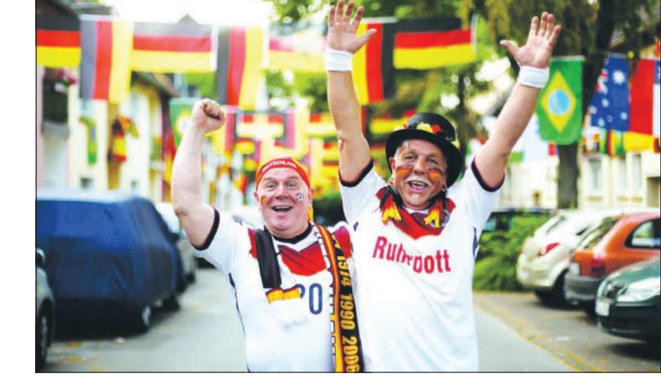
ألمانيان يقضيان أوقتا سعيدة في الموندريال

في كل يوم جديد مع موندريال البرازيل مفاجات في المباريات الى الأرقام القياسية والتصريحات النارية.. وايضا للمال نصيب، فقد أعلن وزير الرياضة البرازيلي أدو ريبيلو من ستاد ماراكانا بمدينة ريو دي جانيرو أن السائحون الأجانب أنفقوا منذ انطلاق الموندريال 365 مليون دولار ببلاد. وأوضح ريبيلو ان هذه العوائد تزيد على نظيرتها بالعام الماضي بواقع 24٪، لافتا إلى ان انفاق البرازيليين خارج بلادهم تراجع بنحو 11٪.