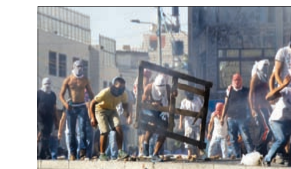
فلسطينيون يرمون قوات الاحتلال بالحجارة والمولوتوف في شغافط