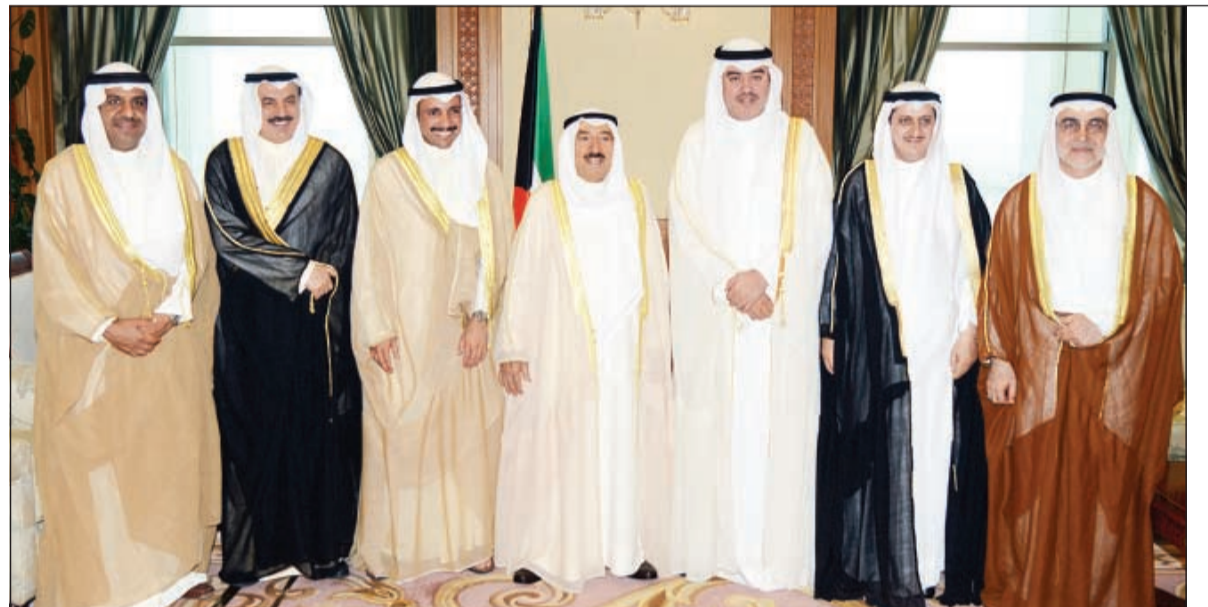
صاحب السمو الأمير الشيخ صباح الأحمد لدى استقباله النواب الجدد وهم أحمد القضيبني وأحمد لاري وعبدالله المعيوف وفارس العتيبي ومحمد الرشيدى بحضور رئيس مجلس الأمة مرزوق الغانم

مؤمن المصري - عبدالله قنص قررت النيابة العامة أمس حبس النائب السابق مسلم البراك عشرة أيام على ذمة التحقيق في القضية المرفوعة ضده من مجلس القضاء الأعلى