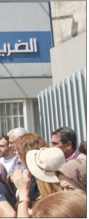
اعتصام هيئة التنسيق أمام وزارة المال احتجاجاً على عدم اقرار الحقوق في مشروع سلسلة الرتب والرواتب (محمود الطويل)

انهمرت ردود الفعل السياسية على اقتراح العماد ميشال عون تعديل النظام اللبناني بحيث يجري انتخاب رئيس الجمهورية من الشعب مباشرة وعلى طائفتين، وطنية، وكذلك انتخاب كل نائب من ابناء طائفته، وقد غلب على هذه الردود الرفض الفوري دون نقاش، فيما لا بد الصمت طوقان: تيار المستقبل الذي اوعز إلى نوابه ووزرائه بعدم التعليق على الطرح العوني لأن التيار يصد اصدار موقف مسدوس، ورفيق 8 آذار الذي وجد في الصمت وعدم التعليق خير سبيل لتجنب الأراج. الأوساط السياسية اللبنانية انشغلت بقراءة المبادرة العونية من مختلف الجوانب، فبدأتها تتطلب تغييراً حاسماً في اسس النظام اللبناني بنحويله من نظام برلماني إلى نظام رئاسي، مع ما يستتبع ذلك من استعادة لصلاحات رئيس الجمهورية من كنف مجلس الوزراء مجتمعاً، والتي تطلب اقرارها نحو 15 سنة حرب، كما ان اطلاقها في الاجراء السياسية والامنية الإقليمية المضطربة لا يشجع فضلاً عن مجيئها في توقيت محلي غير مناسب، ويوحى بأن مفاوضات الحريري - عون انتهت إلى فشل مدقع، وكان العماد عون يريد ان يقول ان طرحة الانتخابي الجديد هو البديل لعدم انتخابه رئيساً للجمهورية.